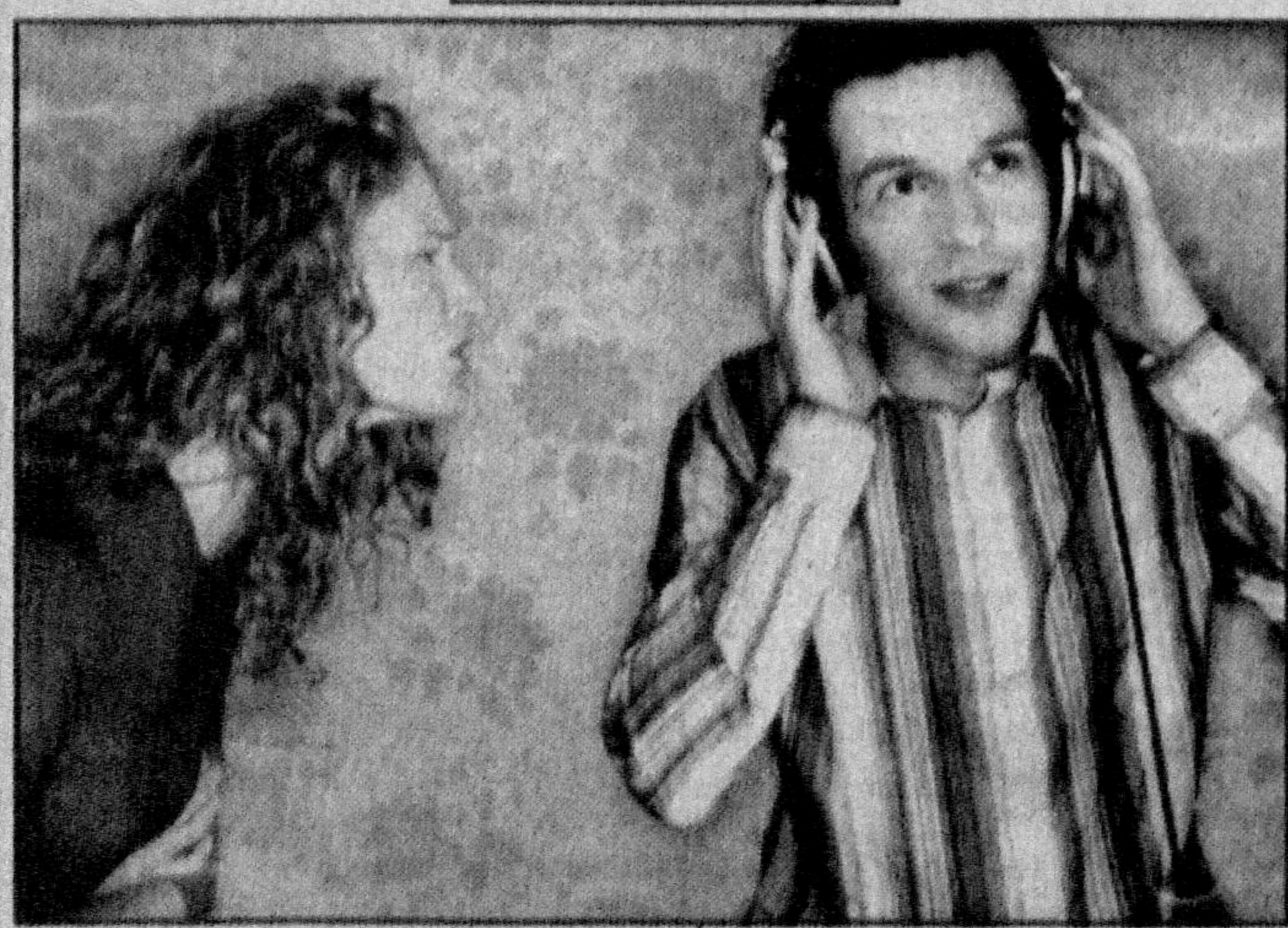
Диалог не получился.