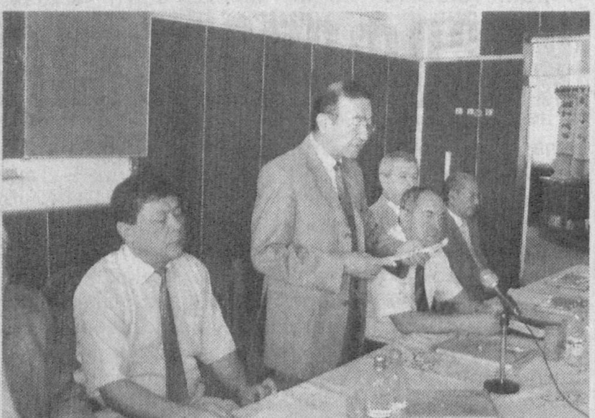
Кўрсатиб, тадқиқотлари натижаларини турли соҳаларда жорий этмоқдалар. Кишилик цивилизациясининг