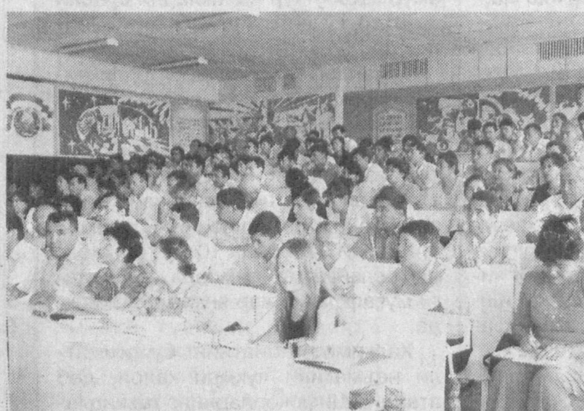
ботидир. Бундан минг йил аввал бу муқаддас заминда "Дарул ҳикма ва маъриф" ёки "Мажлиси уламо"

Хоразм Маъмур академиясининг 1000 йиллиги олдидан кўхна бешиги бўлмиш Хоразмнинг тарихи жуда бой меросга эга бўлиб, минг йилларга бориб тақабил. Шарқ гавҳари Хиванинг 2500 йиллиги, қомусий китоб "Авесто"нинг 2700 йиллиги, миллий қаҳрамонимиз Жалолиддин Мангуберди таваллудининг 800 йиллик саналари жаҳон миқёсида кенг нишонланганлиги бунинг яққол ис-