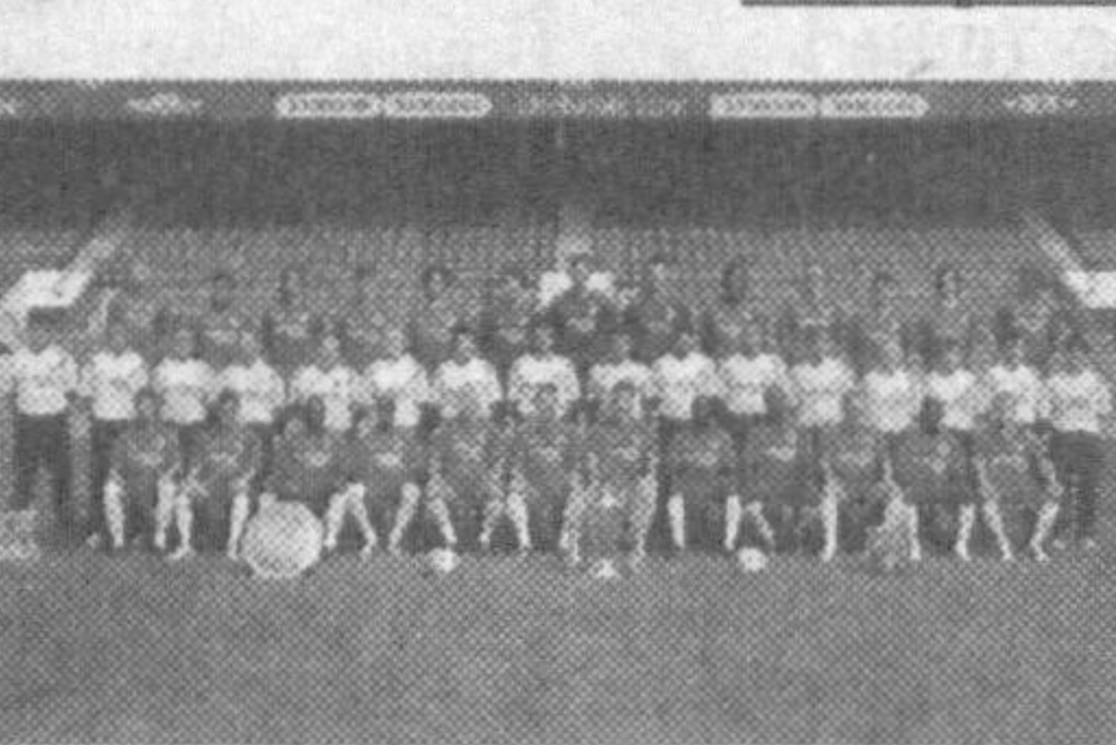
ранглилар мурабийси Марко Ван Бастен ҳам тасдиқлади. Роббен бу фикрни давом эттириб шундай деди:

— Мурабийимнинг сўзлари мен учун ҳеч қандай босим вазифасини ўтамайди. Менинг ниятим битта: жаҳон чемпионатида энг яхши ўйинчи бўлишни истайман ва бунга эришаман ҳам.