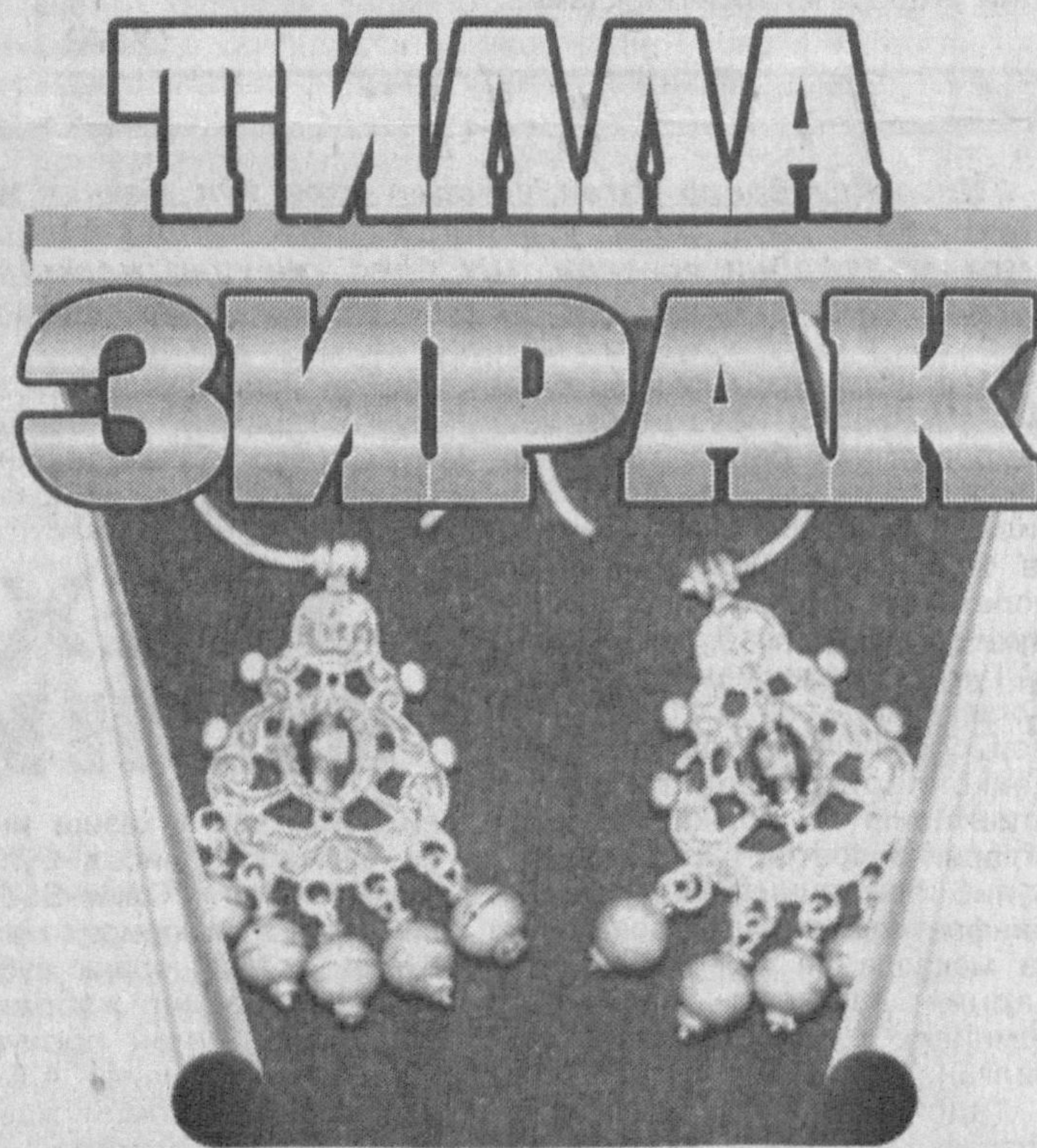
ёки тирикчилигимизда сажда қилган буюмларнинг ўтганимиздан кейинги қадр-қиймати ҳақида

Шу орада зирак йўқолиб қолди. Қидирдик. Бефойда. Кейинчалик билсам, дадам олиб кетган экан. Ёдгорлик ахир. Шу сабабли бир неча бор дадамга зиракни бер-