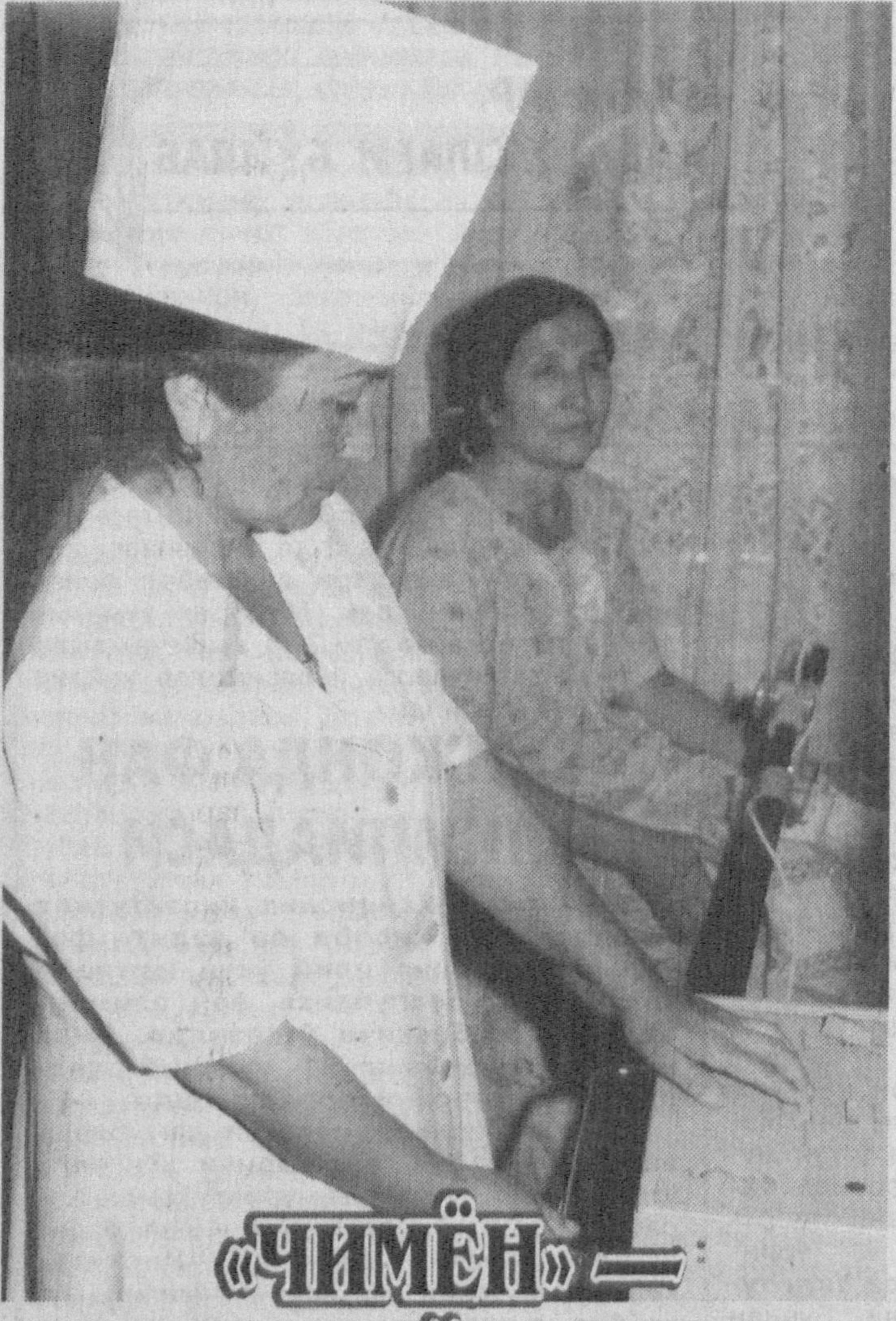
«Чимён» — Водил мўъжизаси

«Чимён» сихатгоҳида, дам олувчиларнинг мароки хордиқ чиқаришлари учун барча шароитлар мавжуд. Жорий йилнинг ўзида бу ерда физиотерапия ва шам билан даволаш учун қўшимча муолажа хоналари ташкил этилди. Бу эса 120 нафар дам олувчи бир вақтнинг ўзида тиббий хизмат кўрсатиш имконини беради.