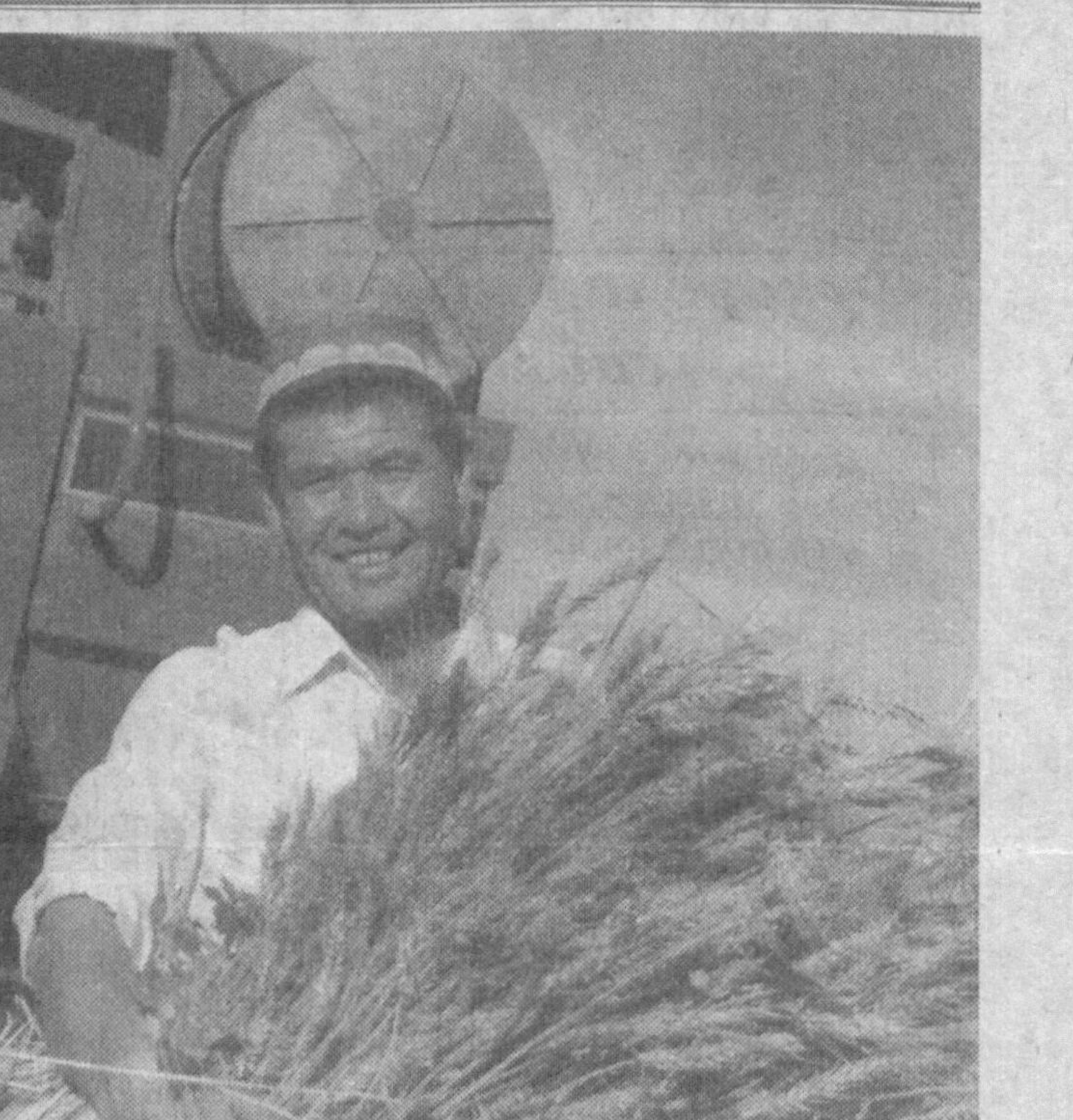
Хирмон тўлиб тўкилди дон

Бу йилги соғломлаштириш мавсумида Наманган вилояти бўйича 11 мингдан зиёд ўғил-қиз сўлим оромгоҳларда дам олдирилиши режалаштирилган. Ана шу муҳим тадбирга пухта ҳозирлик қўрилди. Албатта, бу ўз-ўзидан бўлгани йўқ, Вилоят касаб ва уюшмаси махсус гуруҳлар ташкил қилиб, тайёргарлик ишларини мунтазам назорат қилиб борди. Хусусан, Уйчи туманида жойлашган «Хумо» Поп туманидаги «Офтобча» болалар оромгоҳлари шаънига тахсинлар айтилган бўлса, Норин тумани ҳудудидagi «Норин» оромгоҳида муайян камчиликлар борлиги таъкидланиб, уларни бартараф этиш чоралари белгиланди. Яна бир гап. 6735 нафар кам таъминланган, кўп болали оилаларга имтиёзли йўлланмалар беришга қарор қилинди.