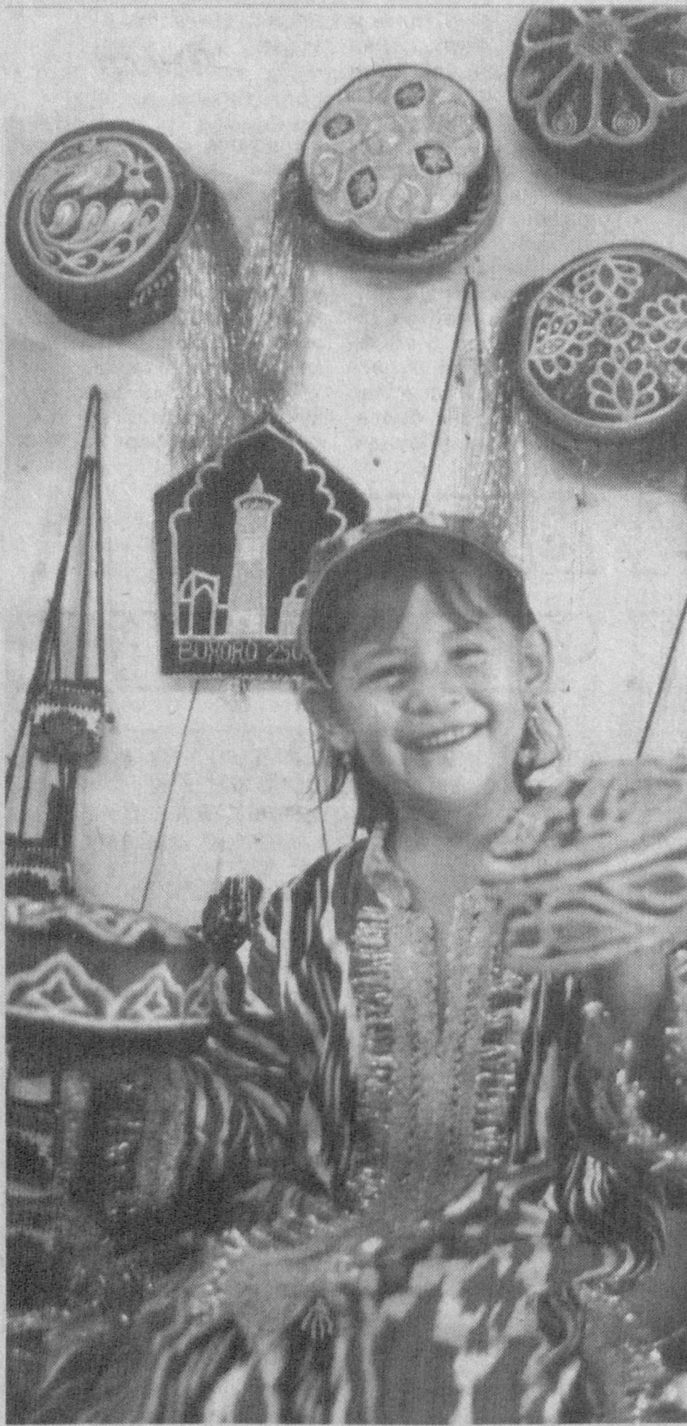
Дўппи тикдим ипаклари тиллодан

Болалар дам олиш масканларини мавсумга тайёрлашда ёнги хавфсизлиги муҳим аҳамиятга эга. Бу жараёнда арзимас туғулган майда нарсанинг ўзи йўқ. Бойси, кичкинагина носозлик туғайди катта ёнгилар келиб чиққанлиги ҳайда кўп кузатишган.