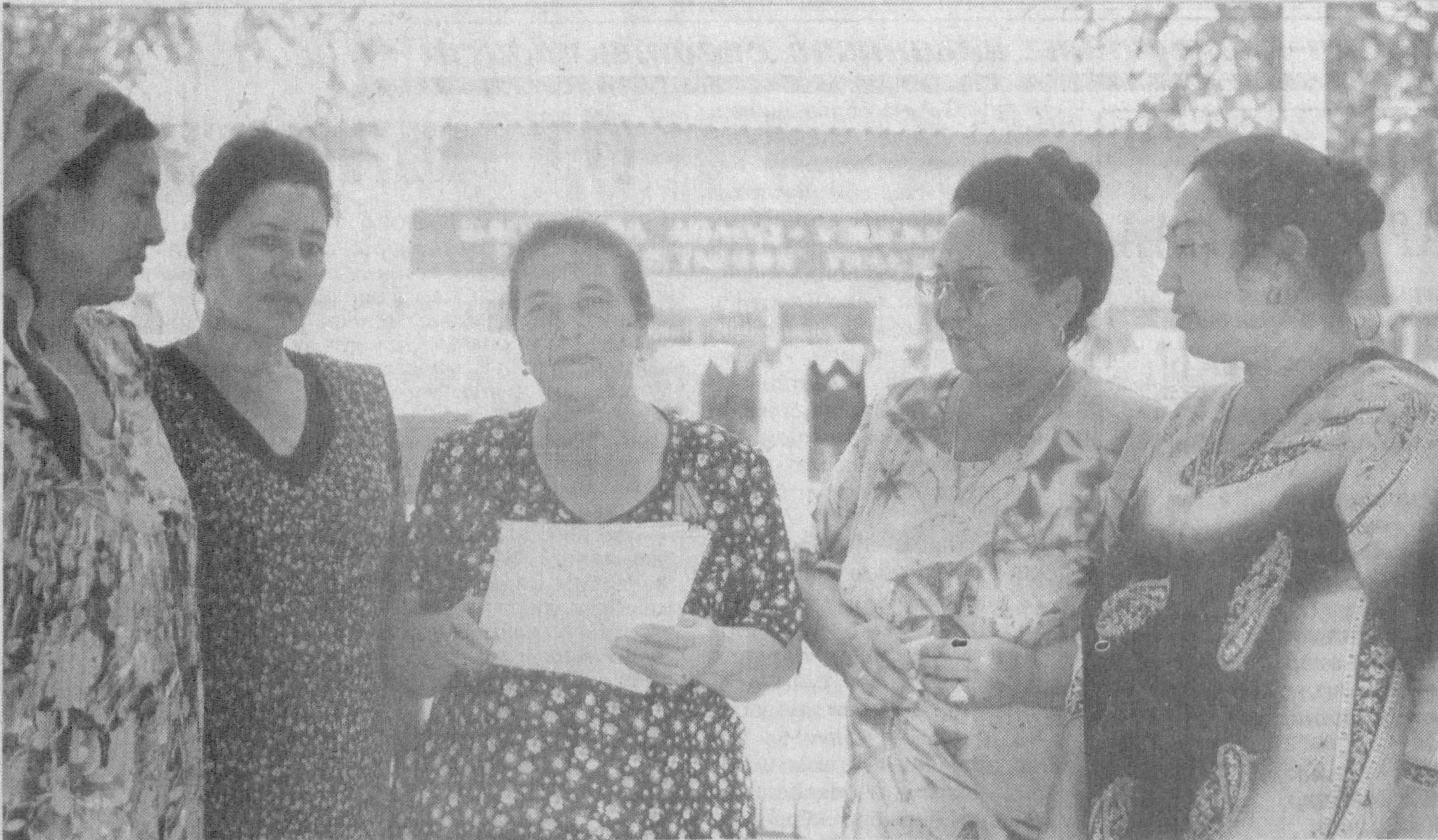
Дўстлик тумани йил сайин гўзаллашиб, файзли бўлиб бормоқда. Бунда, албатта, хотин-кизларнинг ҳам ҳиссаси катта. Улар барча жабҳаларда фаол иштироклари билан