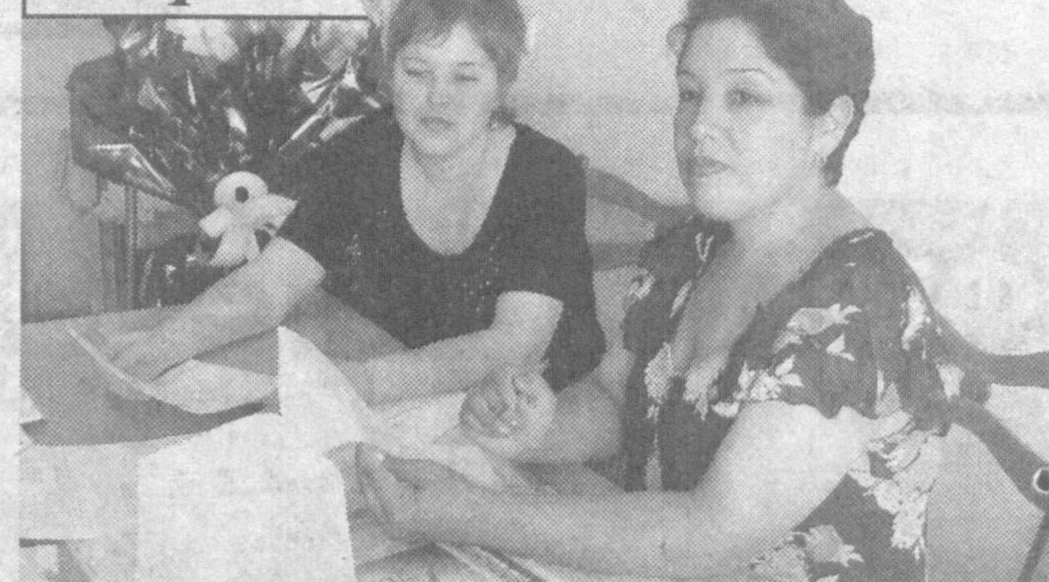
каватида «Ишонч» ва «Ишонч-Доверие» газеталари