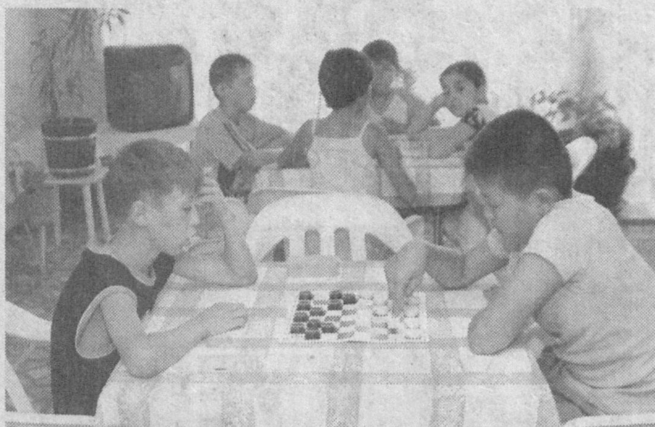
Мазкур анъана бу йил ҳам давом эттирилди. Ёзнинг жазираси бошланган илк кунларданок, бу ерга орольўйлик те-

Пойтахтимизнинг шундоқгина ёгинида, Зангиота туманидаги Назарбек кишлоғида темирўлчиларнинг санаторий-профилакторийси жойлашган. Асосан катта ёшдаги темирўлчиларни соғломлаштиришга ихти-