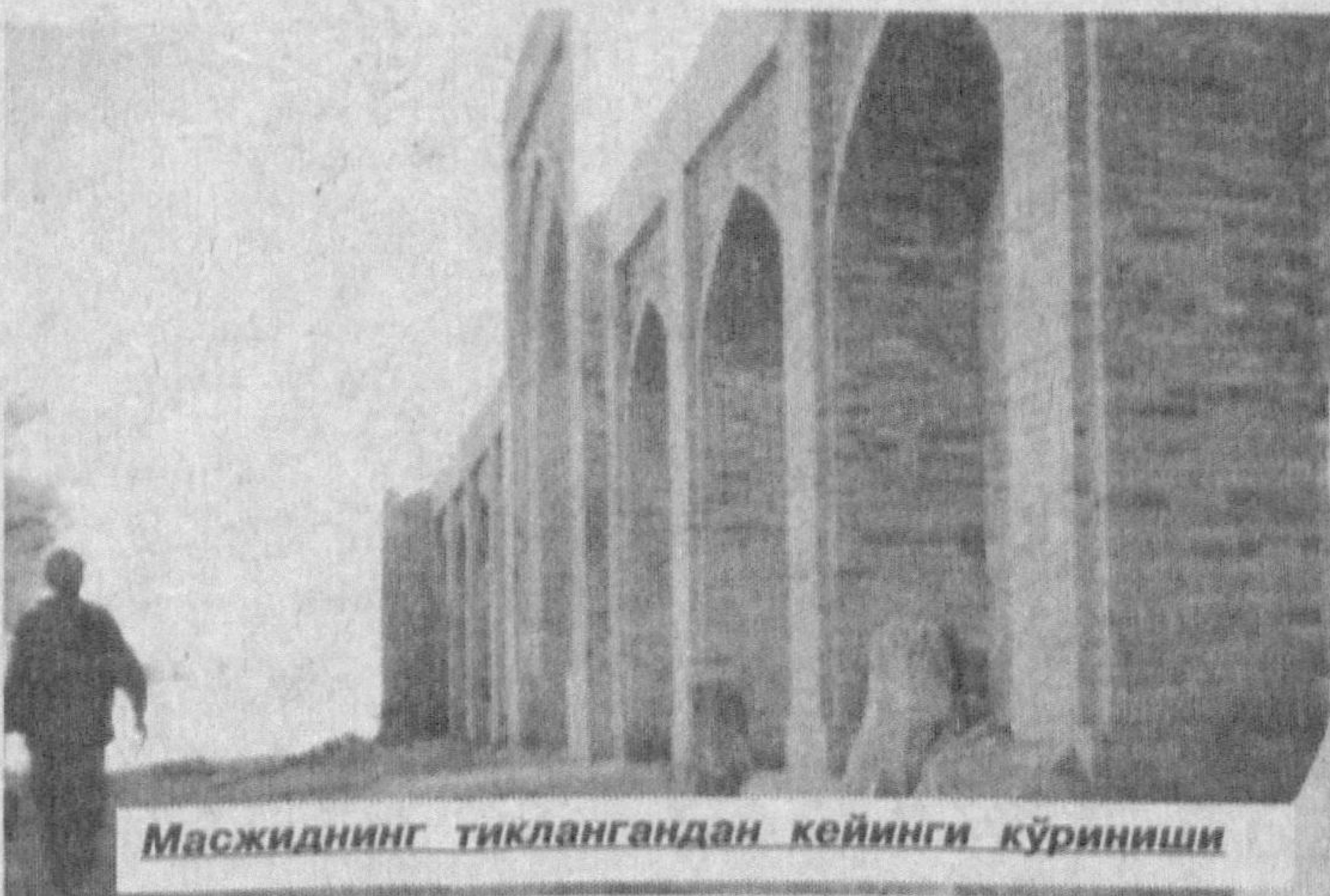
Масжиднинг тиклангандан кейинги кўриниши

мажсус археологик-топографик экспедиция томонидан ўрганилган. Экспедиция ҳужжатларида машҳур археологик олим М.Е.Массон томонидан тузилган XIX аср охири XX аср бошларидида Қарши қўрғонининг чизмаси келтирилган. Ҳар йили Регистон майдони. Айтишларича, майдонга қизил кум тўшалган бўлган. Майдон атрофида Одина масжиди, Бекмироқоз, Ҳўжа Абдул Азиз, Қиличбой, Олий, Нур, Чорбоқ мадрасалари қўйилган. 1920 йилларда Қаршида 20 га яқин мадрасалар бўлган. Ҳозирги кунда Шарофбой, Абдулазизбой, Қиличбой, Бекмироқоз мадрасаларига сақланиб қолган ҳолос. Улар ҳам таъмирга муҳтож.