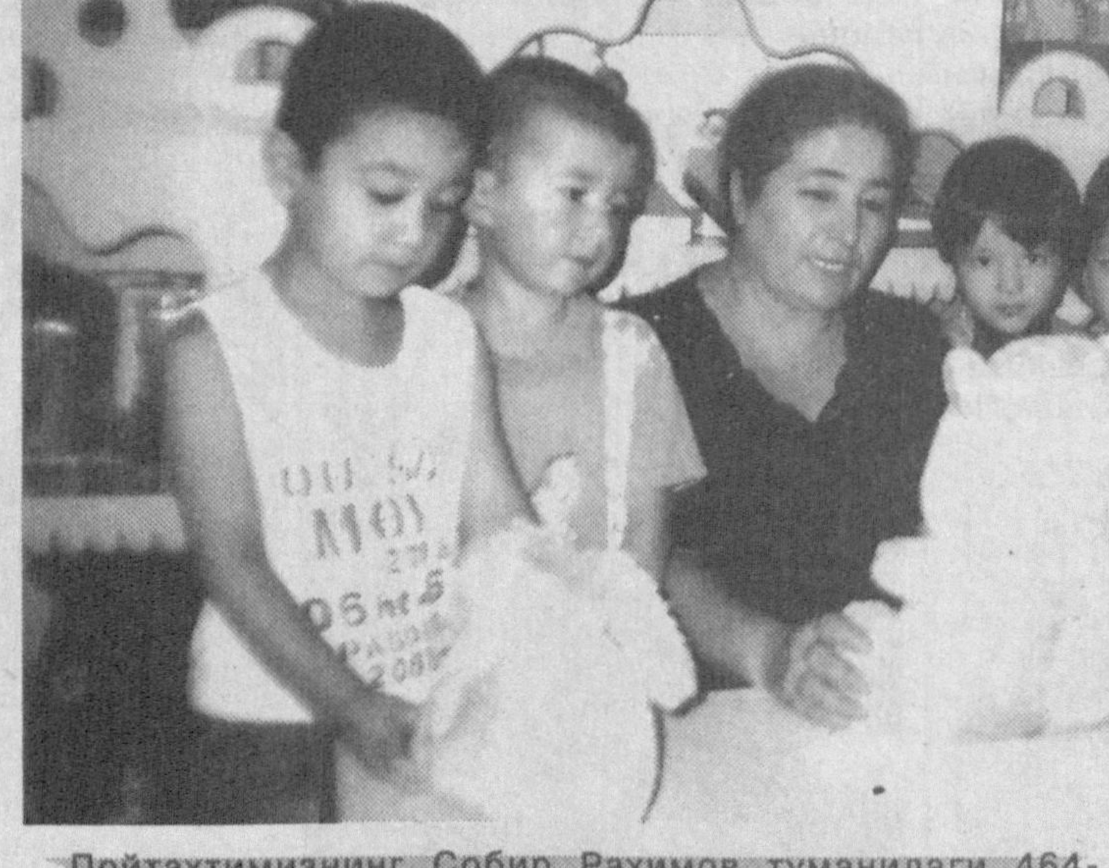
Пойтахтимизнинг Собир Раҳимов туманидаги 464- "Ширинтой" мактабгача таълим муассасасида «Қадрлар тайёрлаш Миллий дастури» ҳамда «Учинчи миңг йил- ликнинг боласи дастури» доирасида ибратли ишлар амалга оширилмоқда. 180 нафар болақонлар тарбия- ланаётган бу масканда барча шарт-шароитлар муҳайё этилган.

рини бош билан берилган зарба белгилаб берди. Футболда тез-тез учраб ту- радиган одатий тўқнашув- лардан бири аввал даҳана- ки жанг, сўнгра эса барча- ни хайратга солиб икки га- леадорнинг биридан иккин- чисининг устуности тарзи- да намойиш бўлди. Хеч қи- тилмаганда ҳақли равишда учрашувнинг энг яхши ўйинчиси бўлиб турган Зи- дан кетаётган жойида орта- га қайтиб, рақибнинг кўкрагига қалла қилди. Бу шунчалик тез содир бўлди- ки, аввалига ҳеч ким ҳеч нарсга тушунмади. Ҳамма- сини кузатиб турган Буф- фоннинг хай-хайлаши-ю, ёрдамчи ҳаммаданнинг ара-