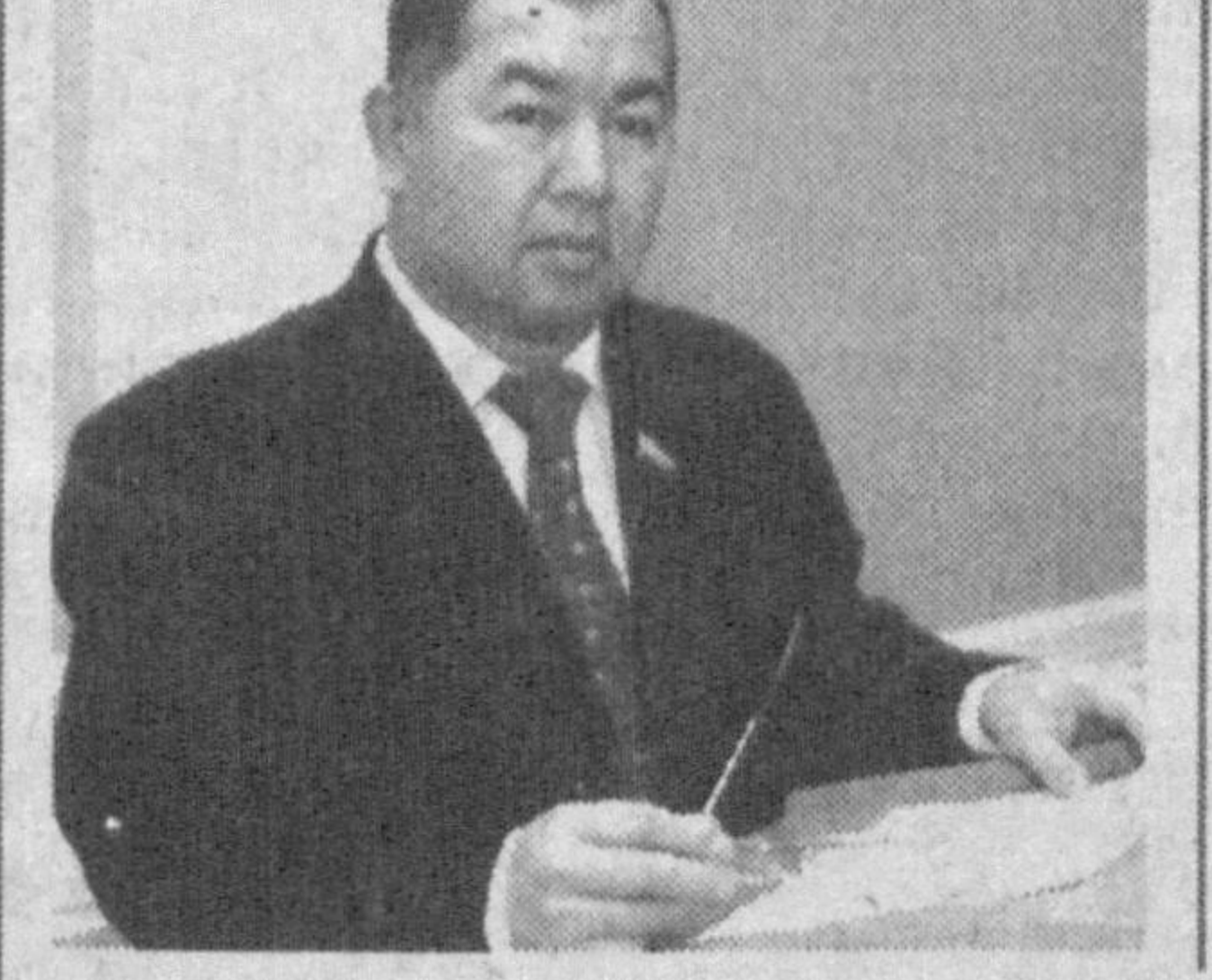
Қонунчиликни, ҳуқуқни қўллаш