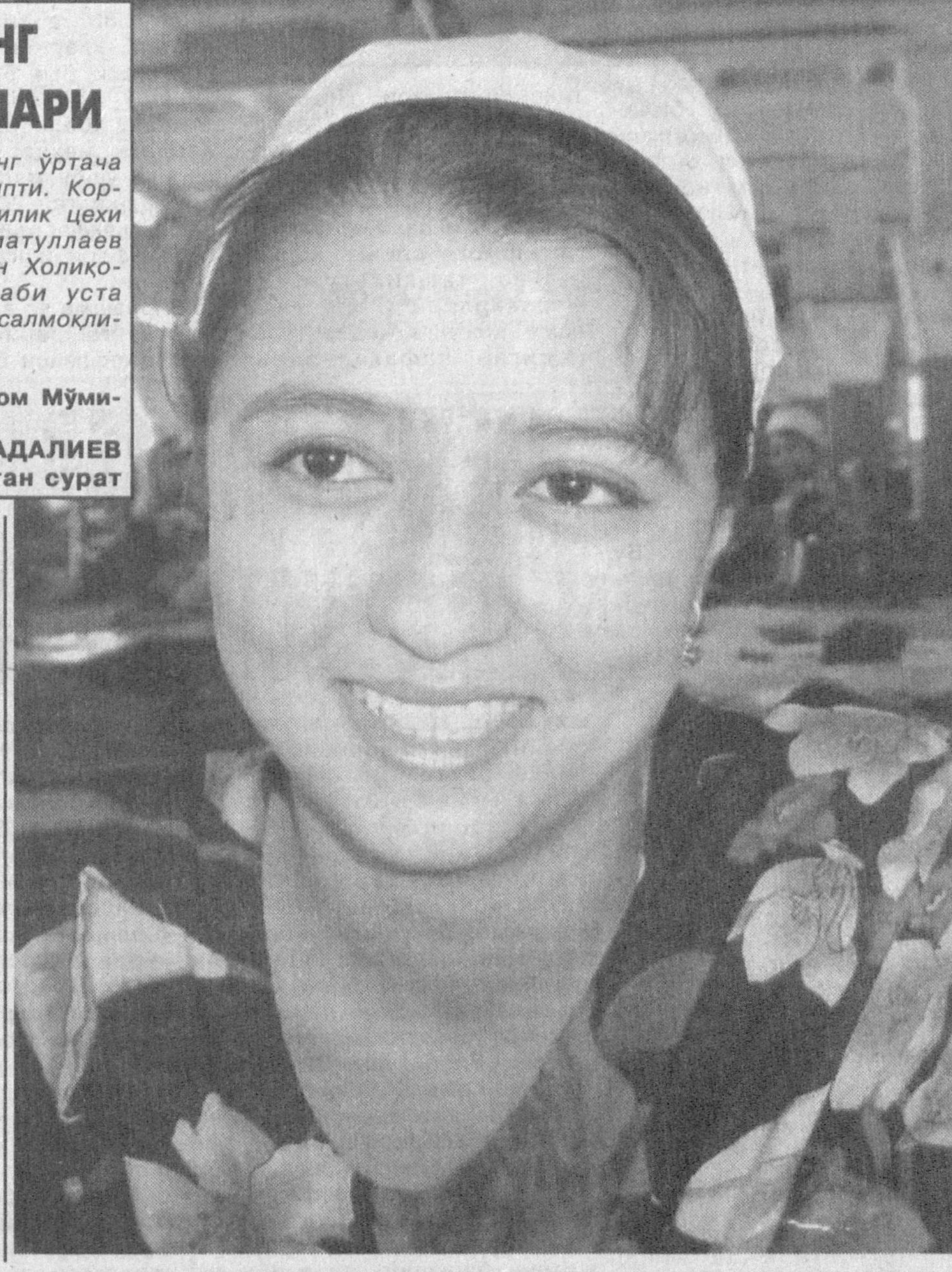
Истиқлолдан — истиқболга