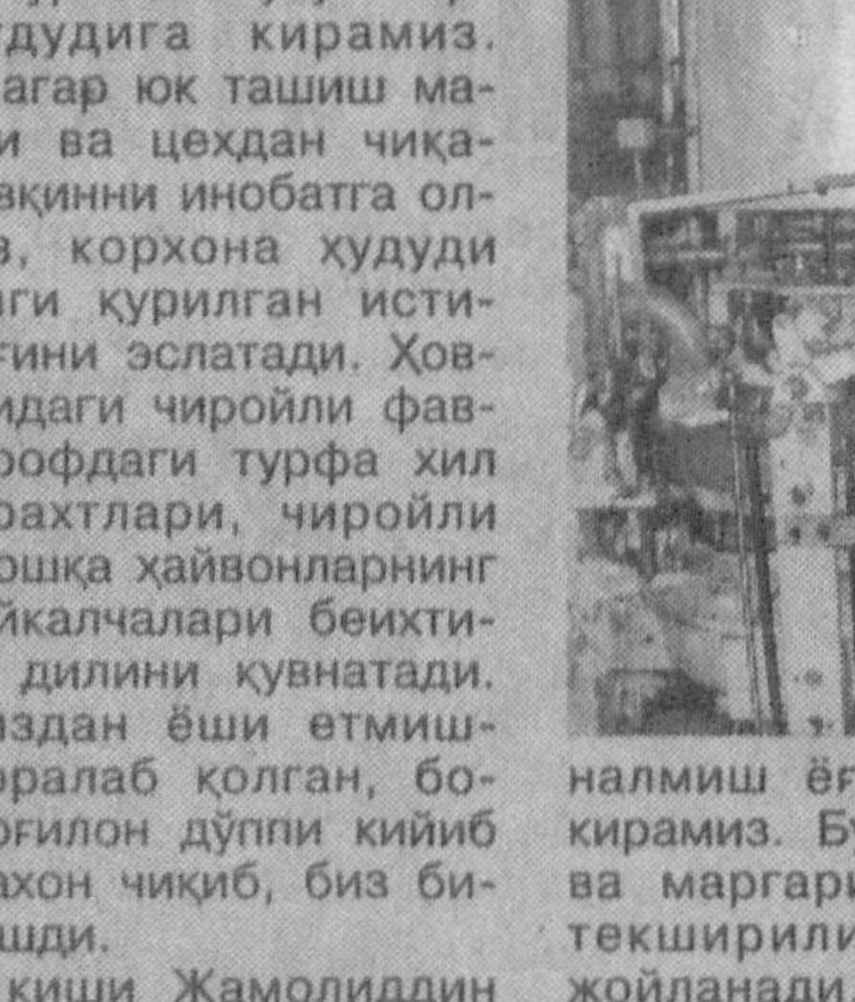
налмиш ёғ қуйиш цехига кираимиз. Бу ерда пахта ёғи ва маргарин сўнгги марта текширилиб, қутиларга жойланади.