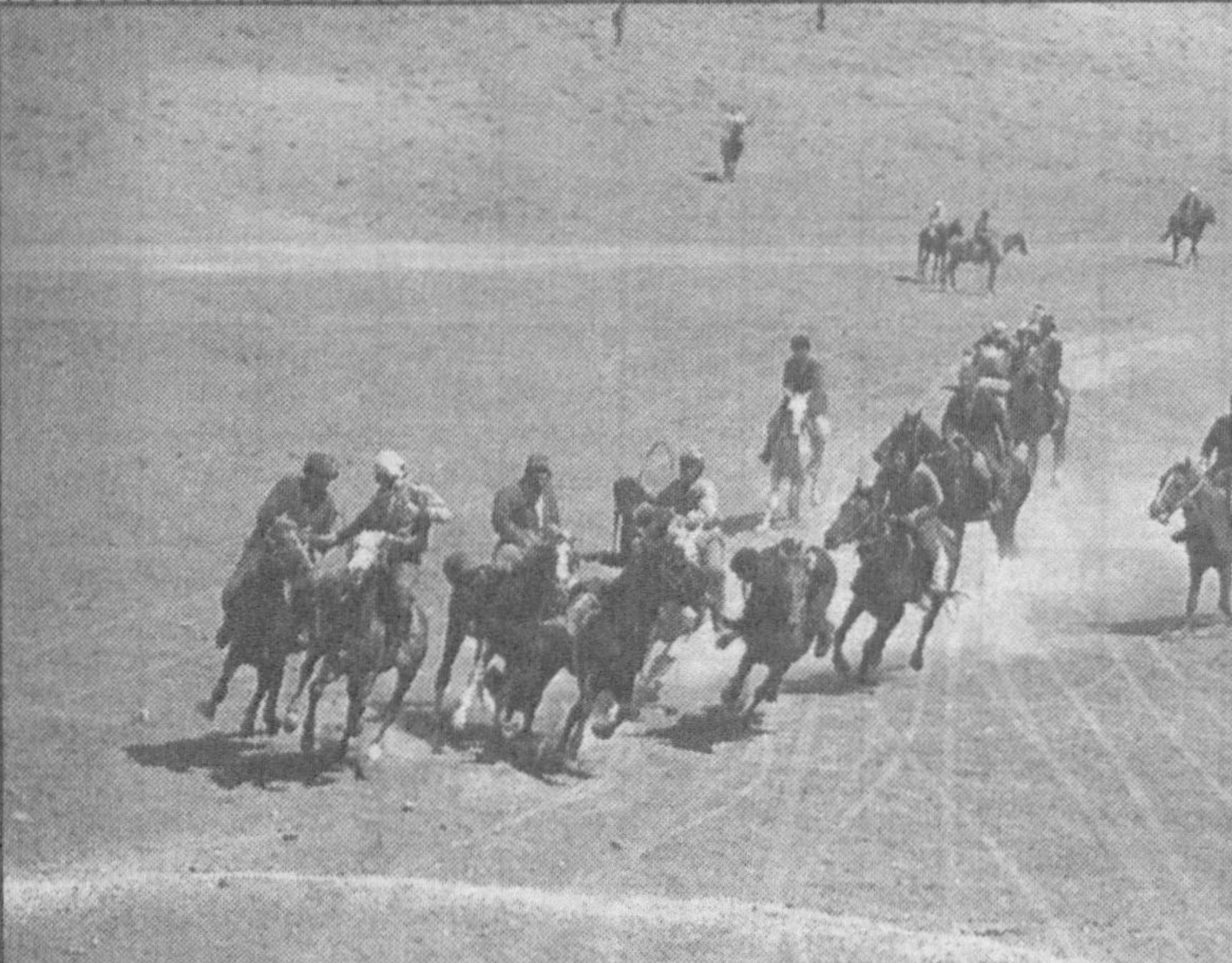
Мозийдан келади бир сир — яширин, Мардлардан сўрагил мард йигит сирин.

Донолар Земшукчи... Ширин ҳосил берур — дўстлик дарахтин ўтқаз, эй инсон, У душманлик ниҳолин юлки, бергай ғам, алам, армон. Хофиз ШЕРОЗИЙ