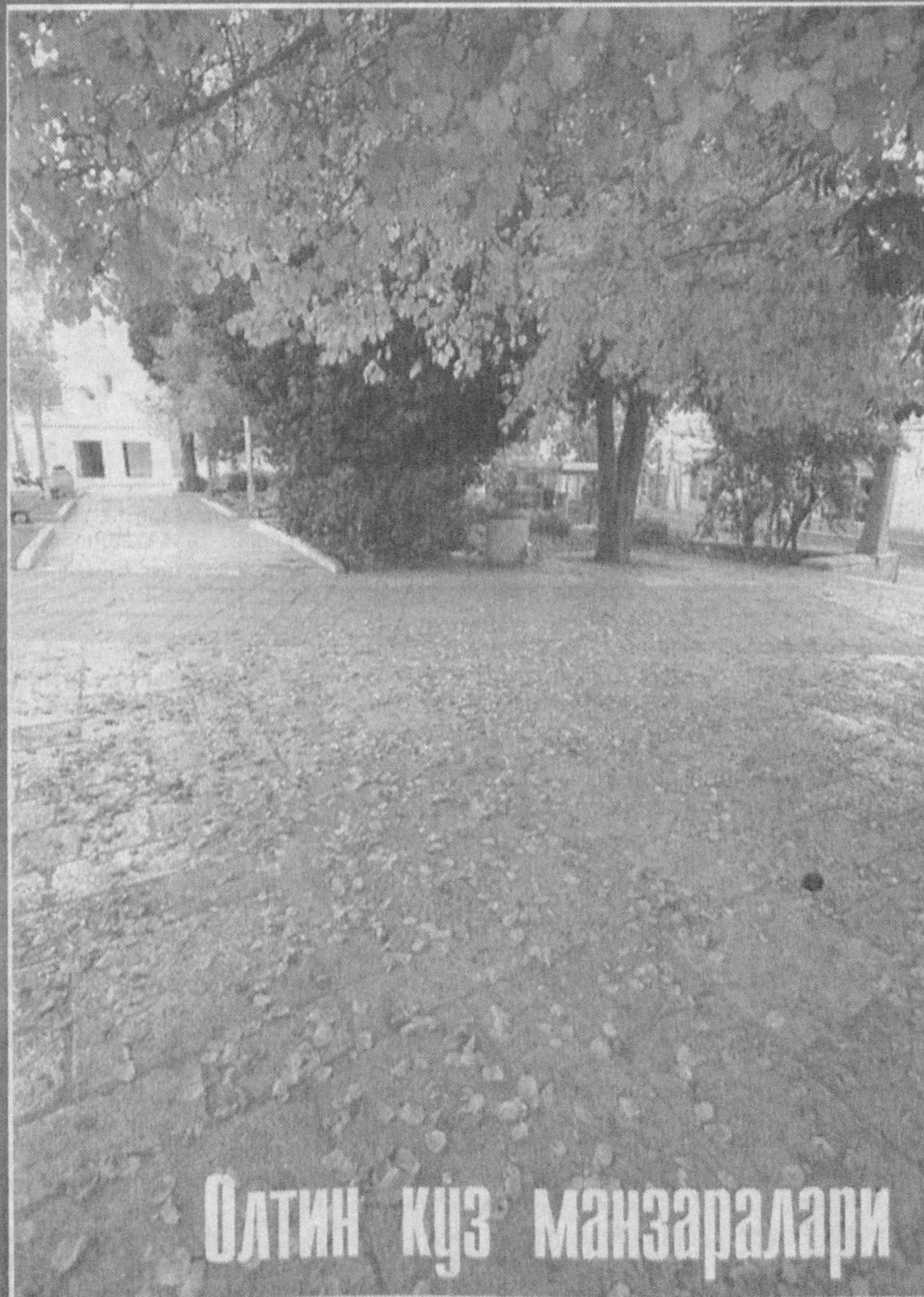
Олтин кўз манзаралари