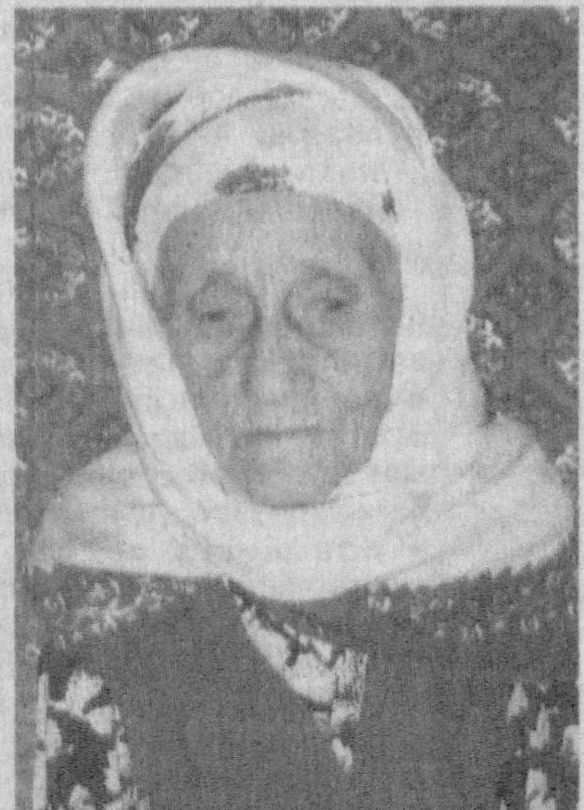
бор. Ана шу ҳикмат маъно-моҳи- яти Жумагул момонинг ҳаётида ўз тасдигини топган.

Донолиги чехрасида акс этиб турган Жумагул момо яқингача, яъни неварра келинли бўлгунча сигирларни ўзи соғар, хамир қориб, хоразмча зоғоралар ёпар экан. Уч аср билан юзлашган бу табаррук зот сиймосида ўзбек оналарига хос сабрлик, шукро- налик ҳислари балқиб туради. Қолаверса, халқимизда «ҳара- катда-баракат бор» деган мақол