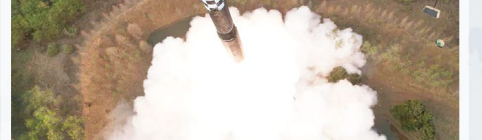
Интернет хабарлари асосида тайёрланди.

Қайд этилишича, синов парвози атропофаги мамлакатлар хавфсизлигига ҳеч қандай салбий таъсир кўрсатмаган. Биринчи босқич Хамгён-Намдо провинциясида, иккинчи босқич Хамгён-Пукто провинциясида денгизга қулаган.