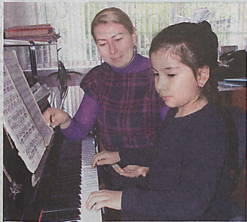
Детская школа музыки и искусства №1 имени Т. Садыкова - место с большой историей. Ее выпускники - талантливые артисты театра и кино, музыканты и певцы.

Школа названа в честь знаменитого композитора и дирижера, который всю свою жизнь посвятил искусству. Именно с его именем неразрывно связано становление узбекского музыкального театра. Юным дарованиям здесь стараются привить любовь к искусству, которую сам maestro называл "причиной творить, жить".