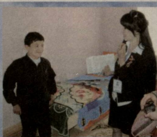
«Обод кўнгили — обод юрт» танловига