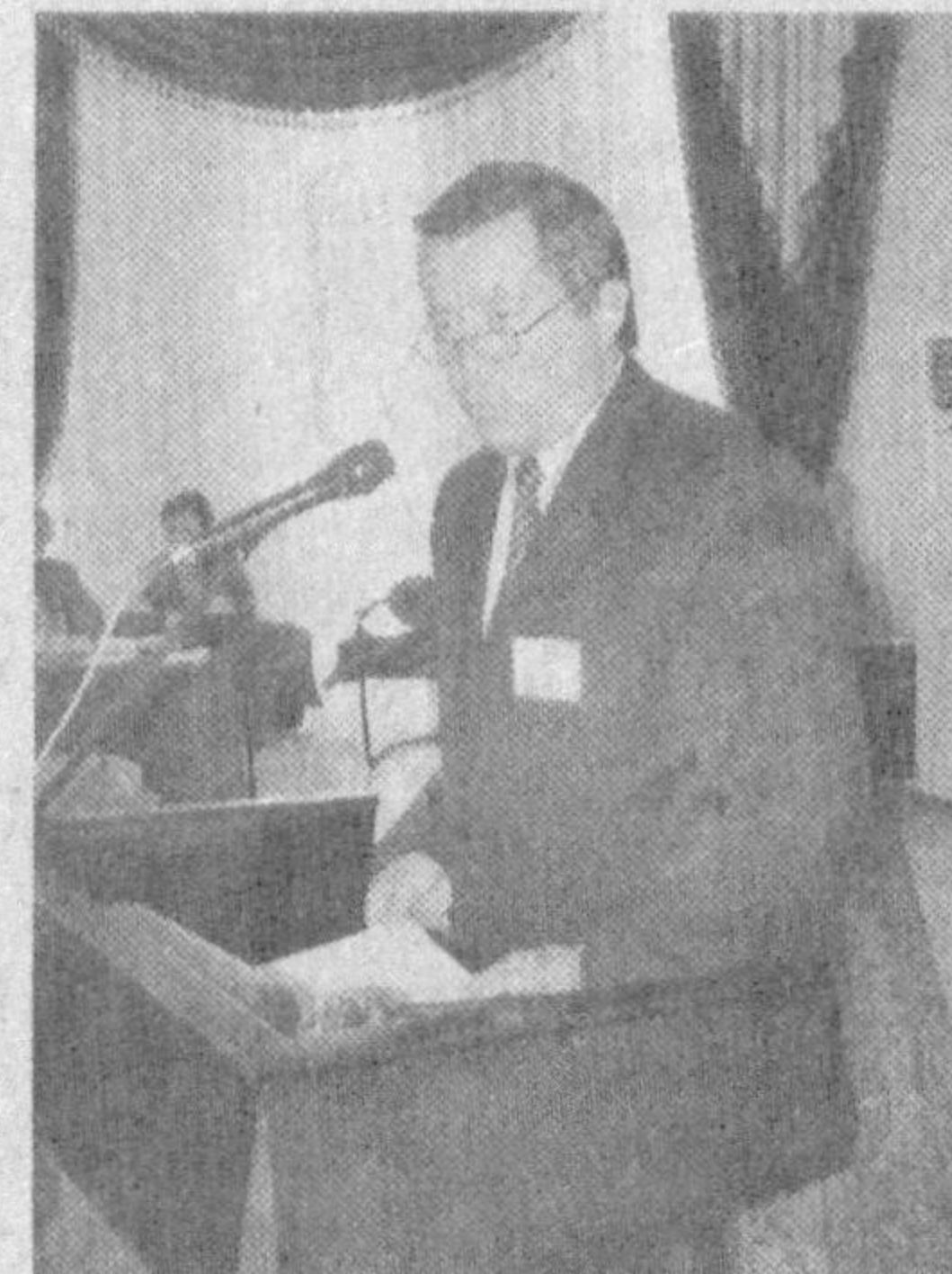
капиталга эга бўлиш ҳамда кейинги фаолиятларини ўзимизда давом эттиришни мақсад қилиб қўйишган. Улар банклардан кредит олишмайди, ишни ўз сармоялар ҳисобидан давом эттиравершади.

Мигрантларга ижтимоий кафолатлар беришдаги асосий масала уларга ҳақ тўлашни тўғри ташкил этишдир. Авваламбор, чет эллик фирма ҳамда компания эгалари мигрантларни таклиф этишдан асосий мақсади уларга мамлакатда белгиланган иш ҳақидан камроқ маош тўлашдир. Тузиладиган шартномаларда бунга адолат билан ёндашмоққа алоҳида эътибор қаратилоғи зарур.