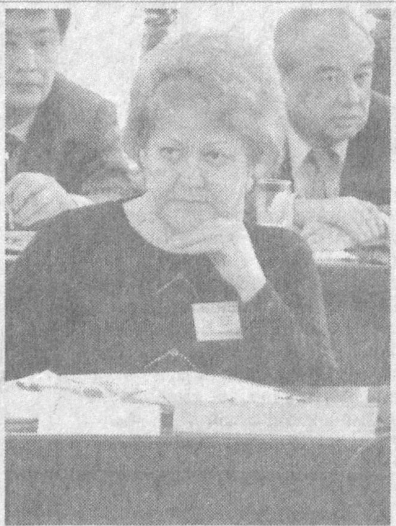
рисоладагидек меҳнат шароити яратиш бериш учун ўз бериб ишлаш керак. Ахир кишини бошқа мамлакатга бориб ишлашга ўз уйида олаётган маоши етарли эмаслиги мажбур қилишини ким билмайди, дейсиз.

Хуллас, Евроосий Иқтисодий Ҳам-жамиятига аъзо мамлакатлар касба уюшмаларининг гапи ўзаро бир жойга қўйдиган масалаларни ангайна. Ижтимоий мулоқотни йўлга қўйиш зарур. Ва албатта, ўз мамлакати ичка-рисиди, авваламбор, ҳар бир ходимга