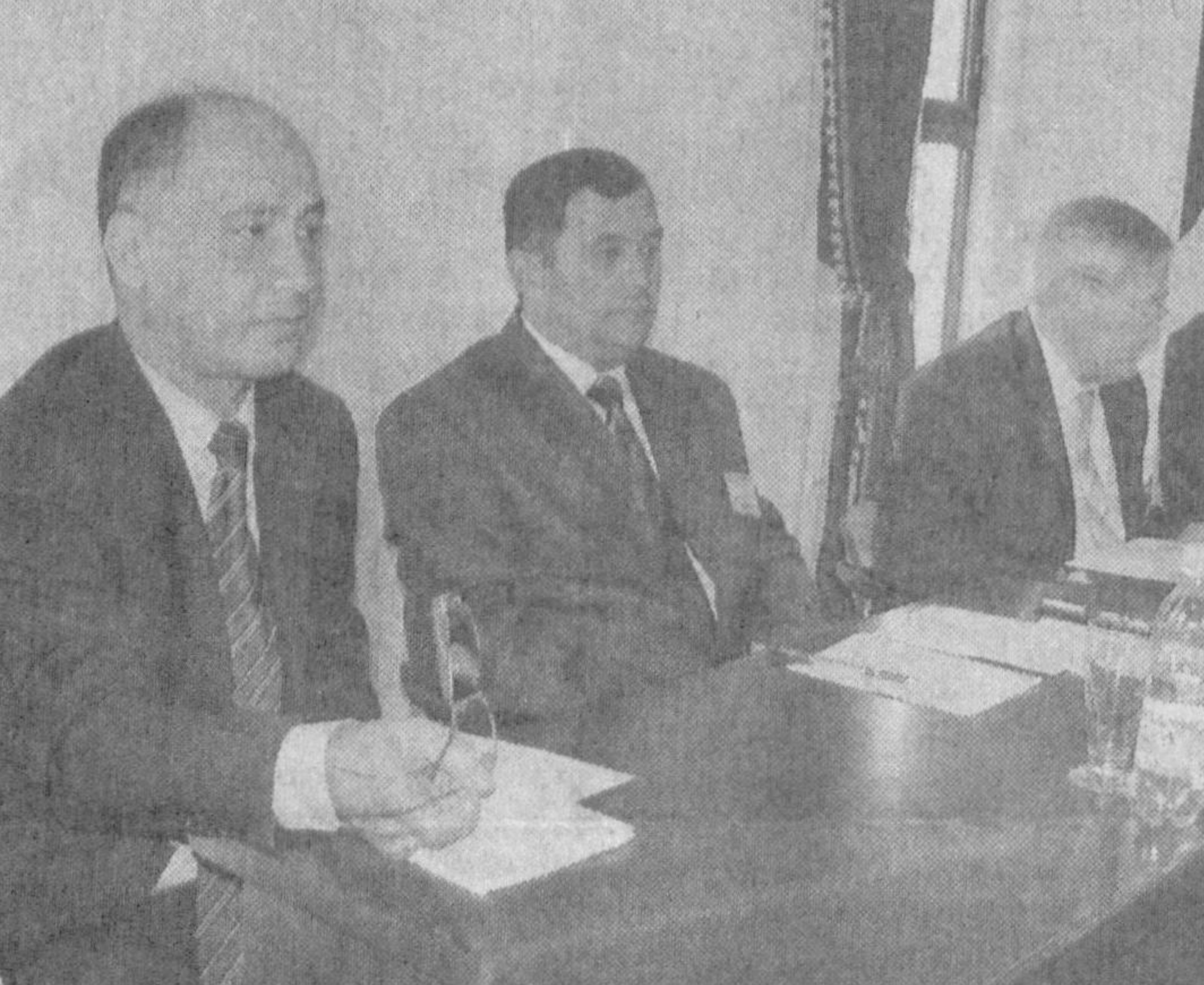
Шунингдек, қасаба уюшмалари иштирокида 2005-2007 йилларга мўлжалланган республика миқёсидаги дастур қабул қилинди. Булар меҳнатни муҳофаза қилиш ва таъминлаш бўйича таъминлаш, аҳоли бандлиги, ижтимоий ислохотларни чуқурлаштириш дастурларидир.

Биз легал муҳожирлик тарафдоримиз. Токи улар Россия ҳудудида меҳнат фаолиятини амалга ошириш баробарида тиббий хизмат, таълим, ижтимоий сугурта, ҳуқуқий ҳимояга эга бўлишсин. Самарали миграция сиёсати нафақат муҳожирлар жўнаётган ва уларни қабул қилаётган томонлар манфаатларига моле қилиши, шунингдек, иқтисодиёт ва жамият истиқболлари учун хизмат қилиши керак. Бу муносабатлар ҳуқуқий ва амалий жиҳатдан барчани қаноатлантириши лозим. Биз бунинг уддасидан чиқишимиз мумкин.