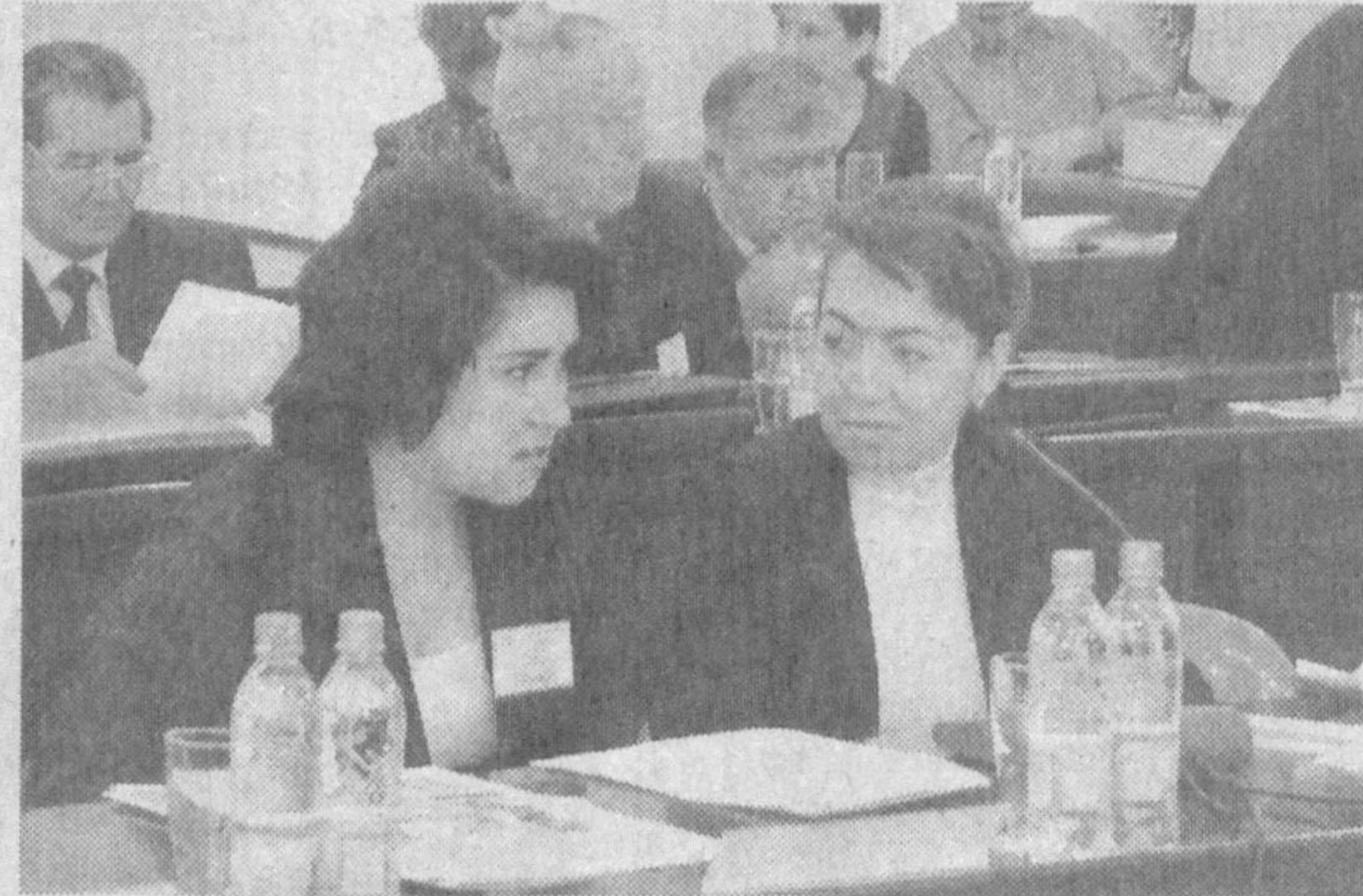
Меҳнатқаш-мигрант ҳамда унинг оила аъзолари мақоми Бирлашган Миллатлар Ташкилотининг Инсон ҳуқуқлари бўйича декларациясида ҳамда бошқа бир қатор ҳужжатларда белгилаб берилган. Шунингдек, 1990 йилда БМТнинг «Меҳнатқаш-мигрантлар ҳамда уларнинг оила аъзолари ҳуқуқларини ҳимоя қилиш ҳақида»ги Конвенциясида бу сўзинг мазмуни аниқ ва лўнда қўрсатилган. У ўзга давлатда ишлаб, пул топаётган шахс. Оила аъзолари эса у билан никоҳда турган шахс ҳамда унинг фарзандларидир.

меҳнат миграцияси соҳасида соғлом рақобат муҳити яратилиши лозим. Ана шу мақсадга қўйиш билан бирга республика фуқароларининг ҳам истаган жойларидида меҳнат қилишлари учун кенг имкониятлар яратилиши лозим. Лекин чет элда меҳнат фаолиятини амалга ошириш истагиди фуқаролар ва фуқаролари бўлмаган шахсларнинг бу ҳуқуқлари қонунларимизда