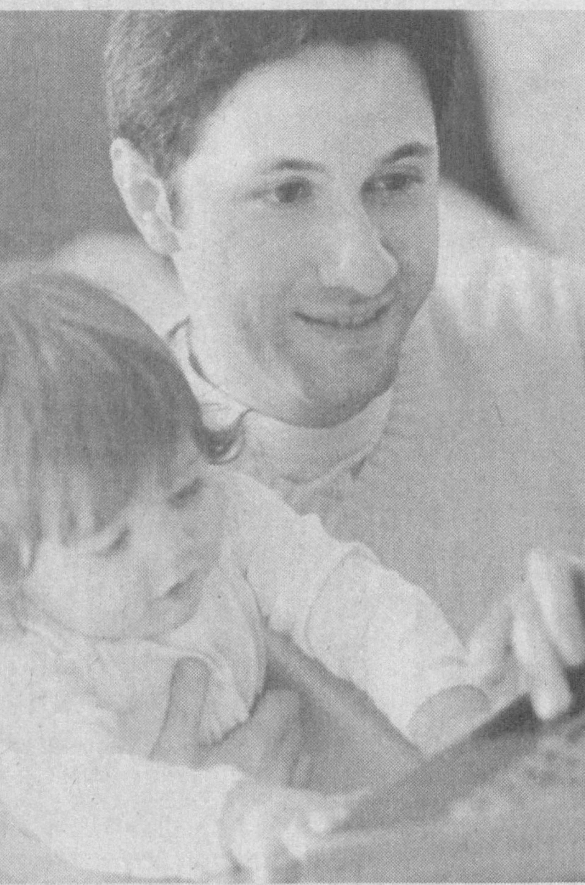
Оиланинг тамал тоши қўйилган маскан ФХДЕ фаолияти ҳам ана шу вазифа билан чамбарчас боғлиқ. Янги, мустақил ҳаёт бунёдкорлари турган ёшларга оилавий турмуш, унинг пасту бандлида учрайдиган муаммоларни оқиллик билан муаммоларни оқиллик билан бартараф этиш, бахтли турмуш тўғрисида тушунтириш ушбу муассаса ходимлари зиммасига масъулият юкляпти.