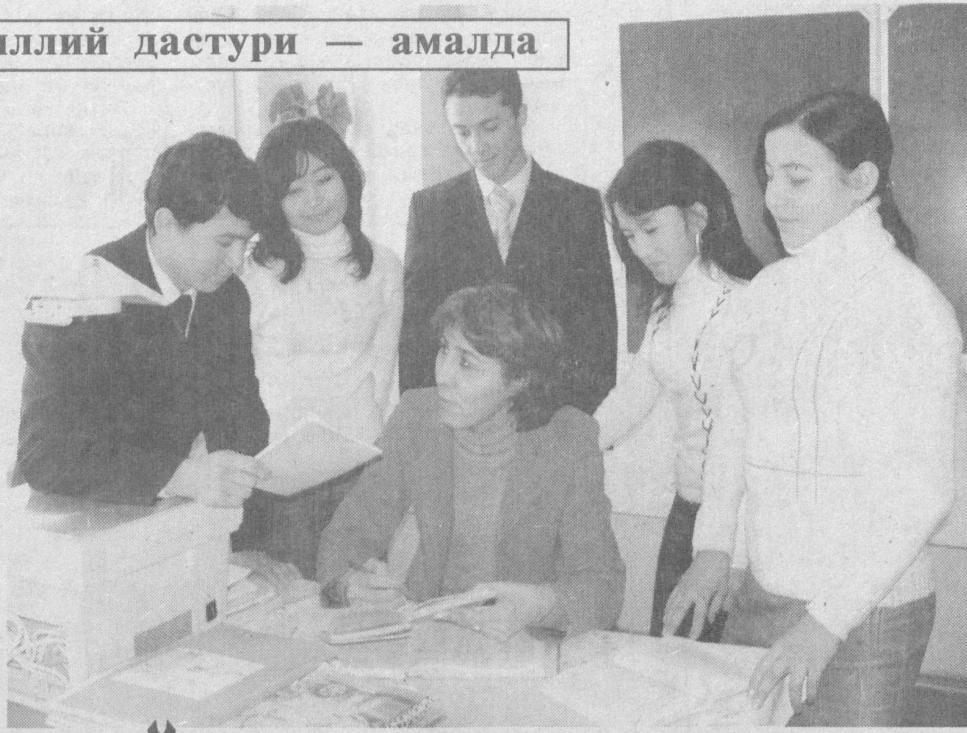
коллек ҳаётидаги янгиликлардан ўқувчиларни бохабар этиб борадилар.

Ўқув масканида банк иши, бухгалтерия ҳисоби, банкларда бухгалтерия ҳисоби, молия ағенти, сугурта иши каби мутахассисликлар бўйича ёшларга жами 166 на-