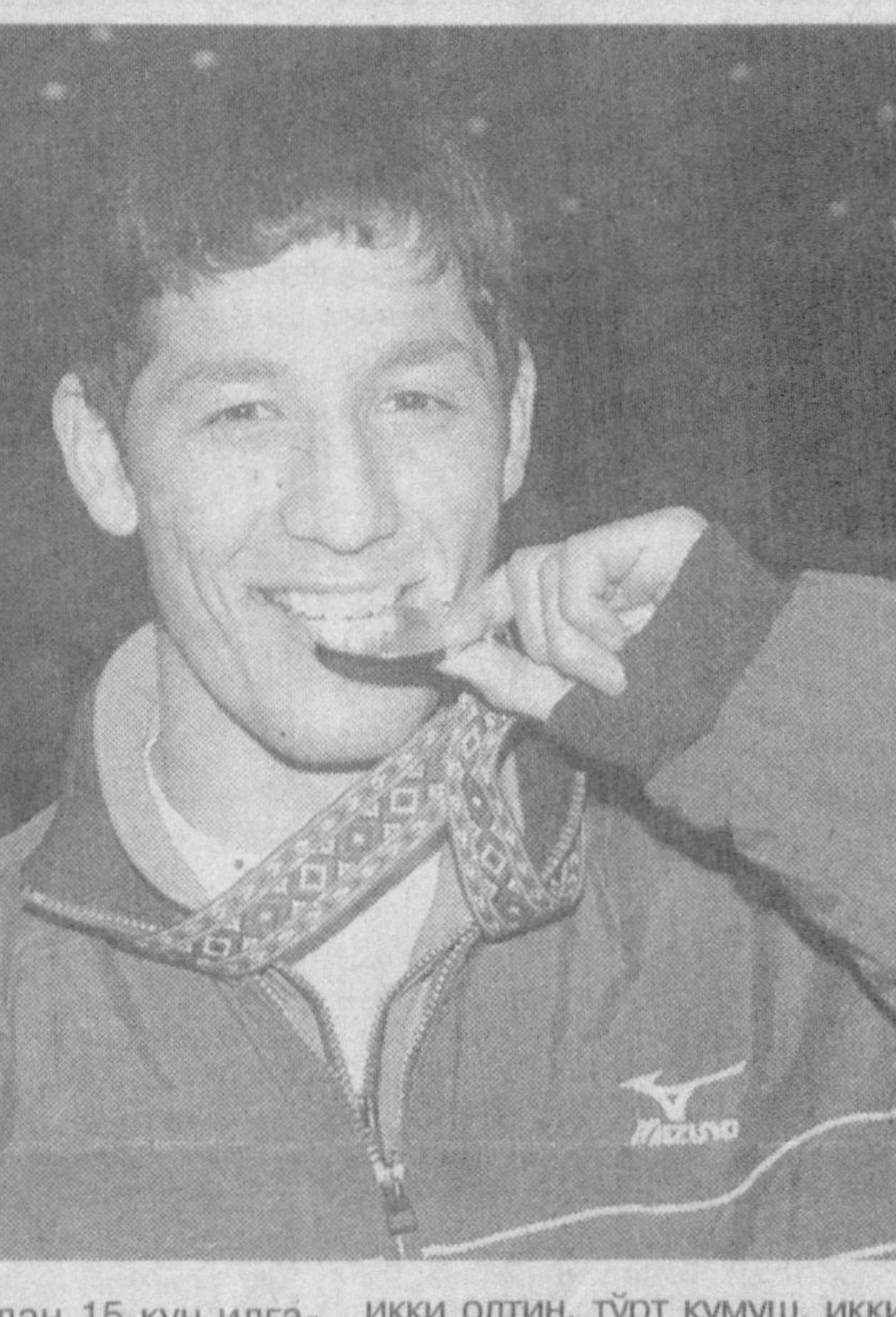
икки олтин, тўрт кумуш, иккита бронза медалларини қўлга киритдик. Бизнинг байдарка ва каноэчилар умумжамоа ҳисоби-да Хитойдан кейин 2-ўринни олишдик. Албатта, бу муваффақиятлар катта меҳнат, чидам ва ишти-шлар завоғига қўлга киритилди.

— Осиё ўйинлари га тайёргарликни аниқ дастур асосида олиб борганимиз кўл келди. Ва айнан 10 — 15 декабр кунига келиб, спортчилар тайёргарли-га «пик» нуқтага, яъни, энг юқори чўққига етди ҳамда биз