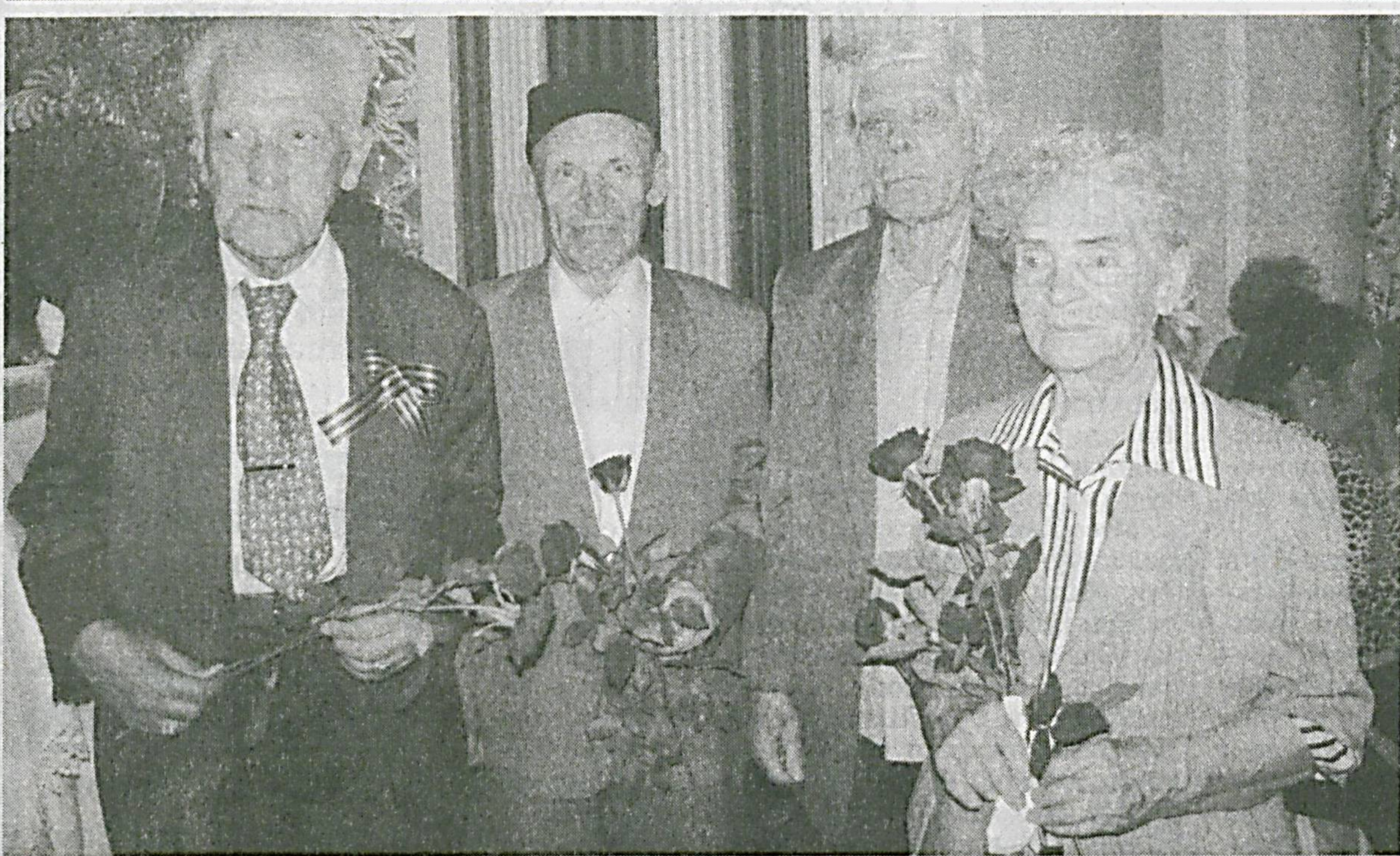
Президентимизнинг шу йил 18 апрелдаги «Иккинчи жаҳон уруши қатнашчиларини рағбатлантириш тўғрисида»ги фармони ижросидан келиб чиқиб, Юнусобод туманидаги уруш қатнашчилари ва ногиронларини рағбатлантириш ва тақдирлаш мақсадида «Биз Сизни унутмаймиз!» шiori остида байрам дастурхони ёзилди. Юнусобод туман ҳокимлиги, Маънавият тарбиёт маркази Тошкент шаҳар Юнусобод тумани бўлими, «Камолот» ЁИХ туман кенгаши, туман «Маҳалла» жамоат фонди, «Нуроний» жамғармаси билан ҳамкорликда ўтказилган тадбир санъаткорларнинг дилтортар наволарига уланиб кетди. «Дўстлик» маданият уйининг ҳажжи рақосалари ижросидаги рақслар байрамга янада хушқайфият бағишлади.