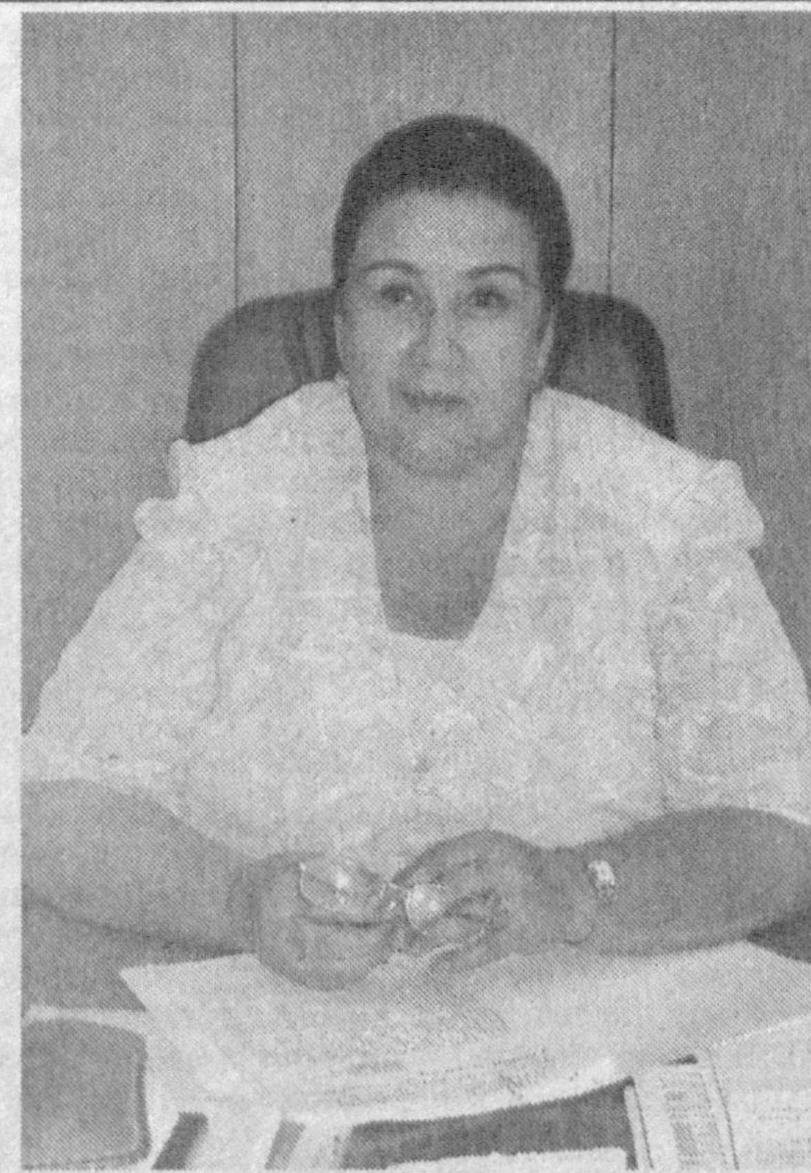
Дилбар ЖАҲОНГИРОВА, Ўзбекистон касаб уюшмалари Федерацияси раиси

(Ўзбекистон Республикаси Конституциясининг 37-моддаси)