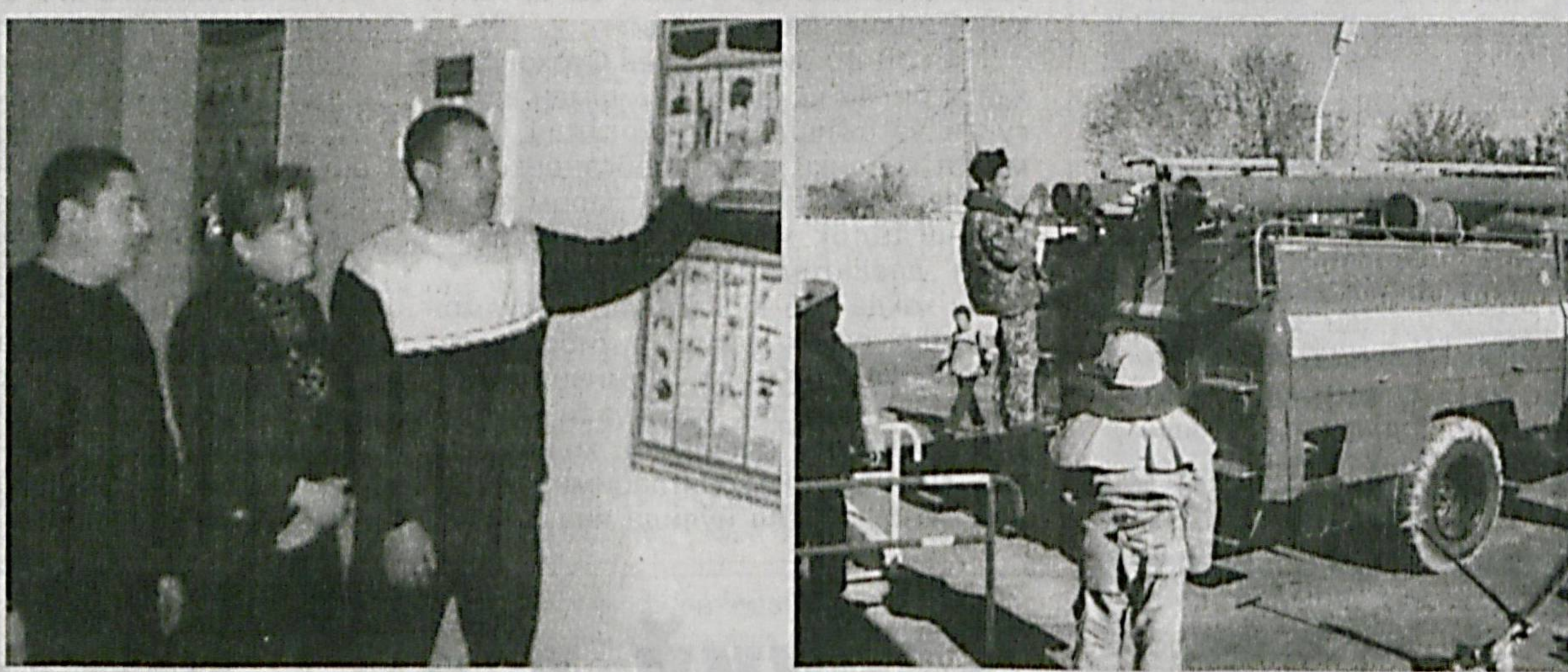
Ўзбекистон давлат муассасалари ва жамоат хизмати ходимлари касба уюшмаси Марказий кенгаши томонидан ташкил этилган меҳнатни муҳофазаси қилиш бўйича жамоатчилик назорати юзасидан республика кўрик-танлови якунига етди. Мазкур беллашувда иштирокчилар «Энг яхши меҳнат муҳофазаси бўйича вакил», «Энг яхши касба уюшма қўмитаси» ҳамда «Энг яхши муассаса» номинациялари бўйича куч синашди.