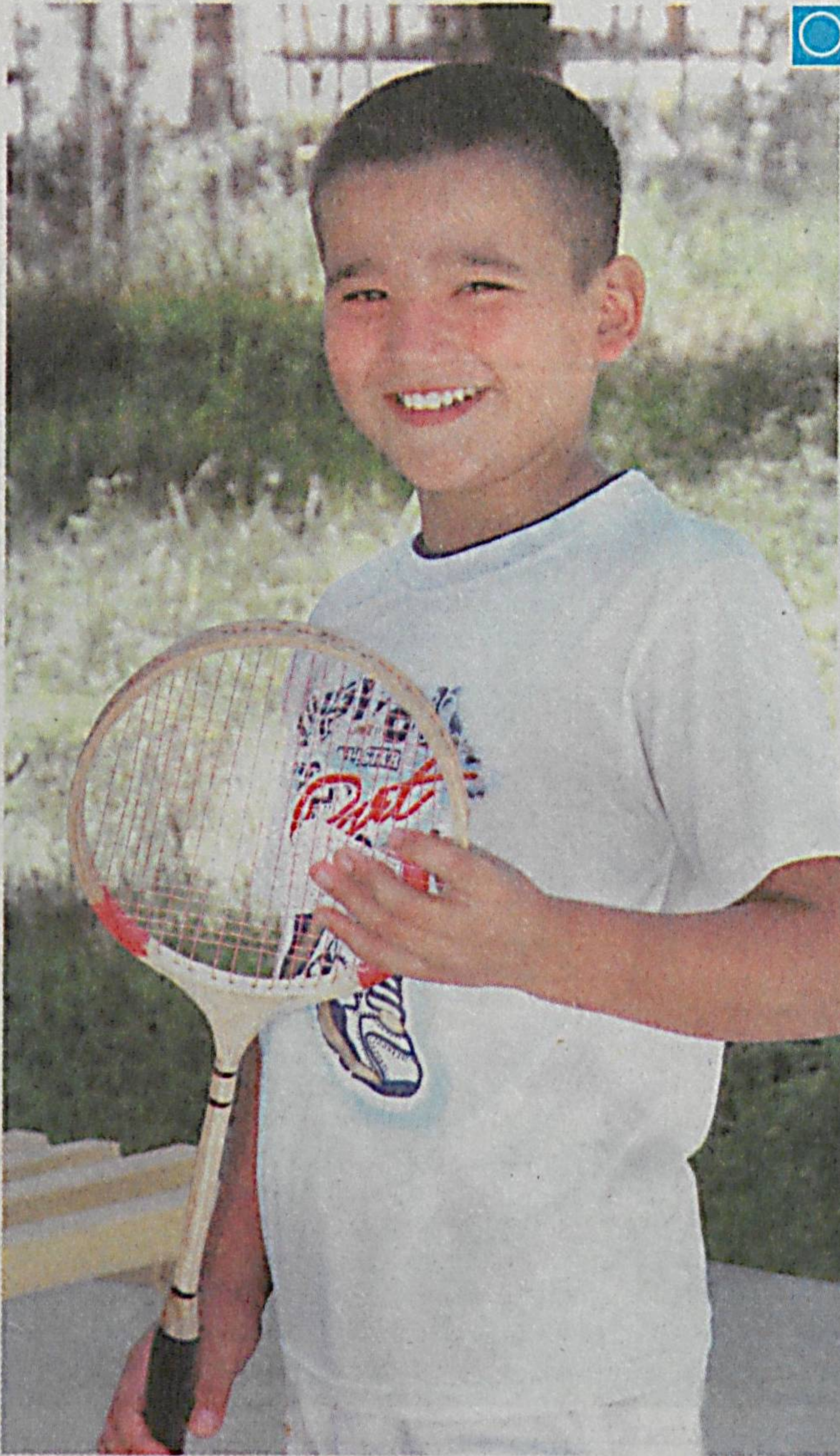
«ЁЗ — 2012»