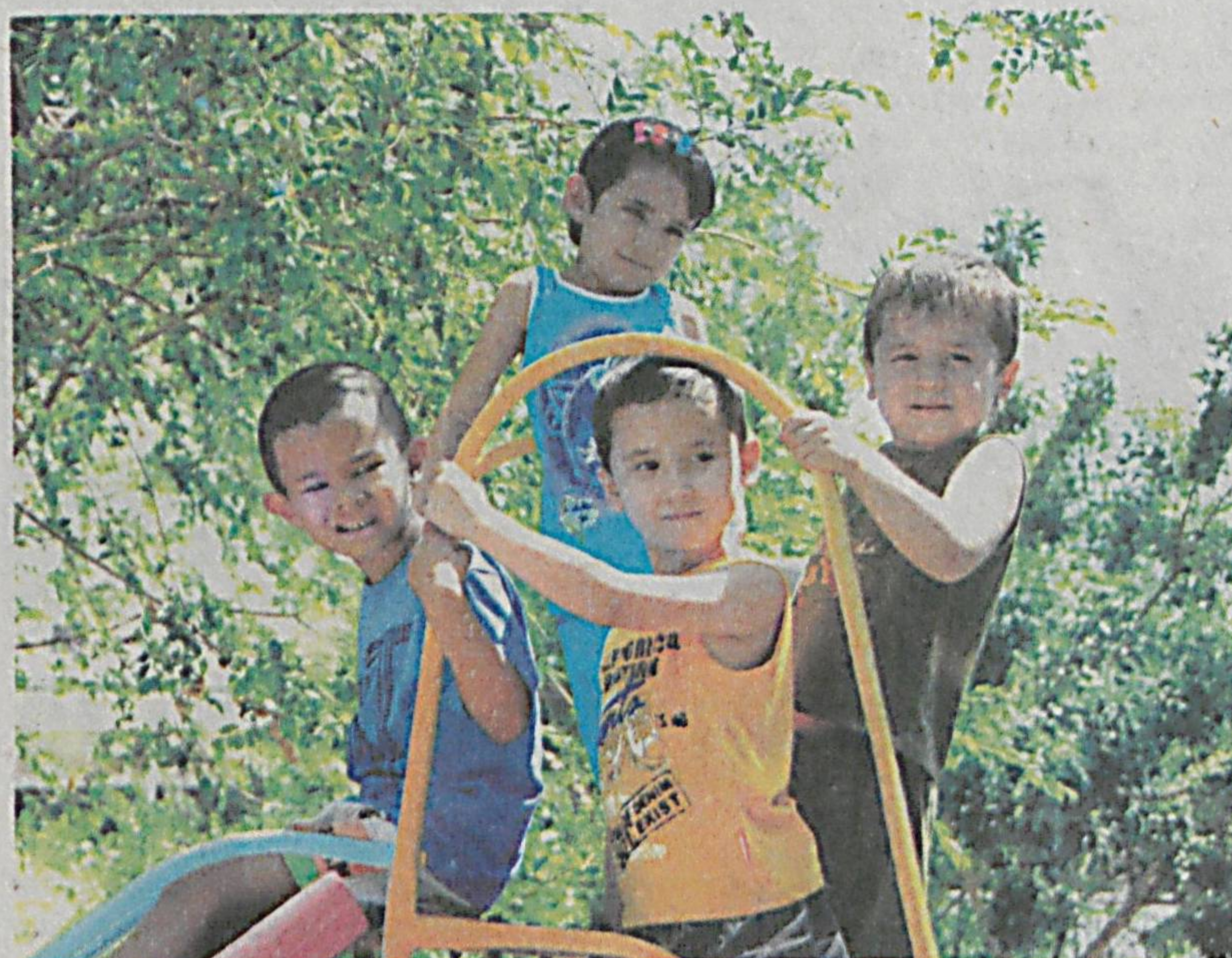
(Давоми. Бошланиш 1-саҳифада).

Оромгоҳларга болаларни қабул қилиш ҳар қачонгидан эрта — 26 майдан бошланди. Айни кунда 945 та оромгоҳда 168 минг 202 нафар бола соғломлаштирилмоқда. Бу 2013 йилги ёз мавсумида болаларни соғломлаштириш режасига нисбатан 62,2 фоизи ташкил этади.