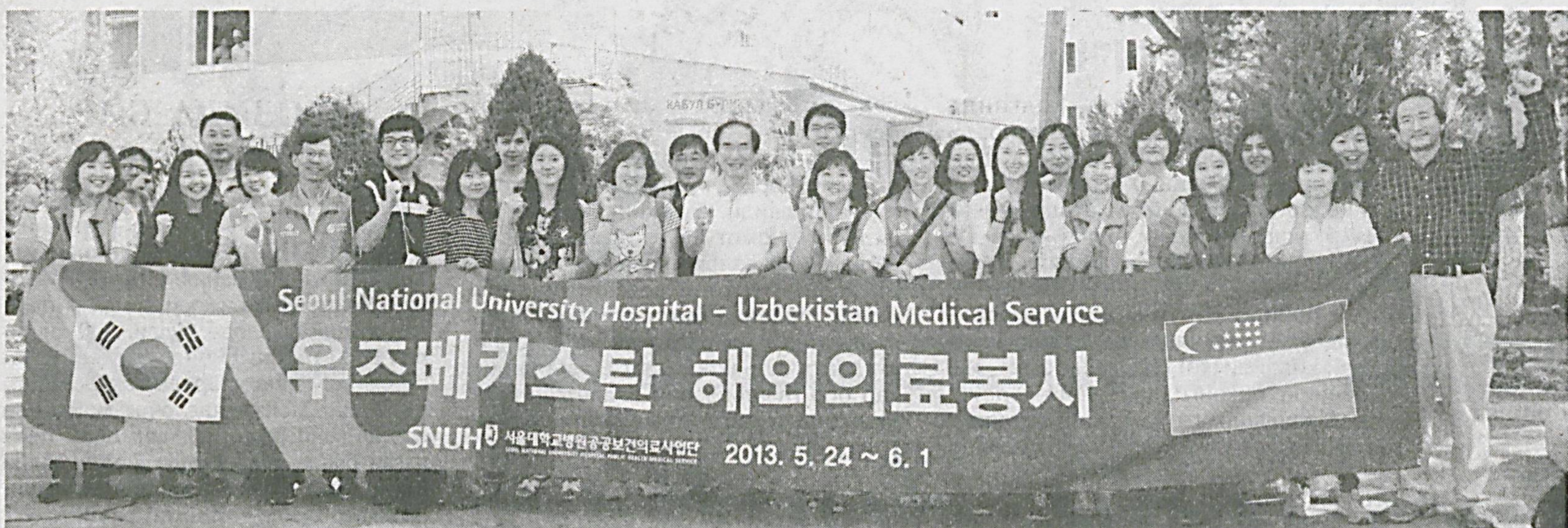
Seoul National University Hospital - Uzbekistan Medical Service узбекистон ҳаётиёловчилари 2013. 5. 24 ~ 6. 1