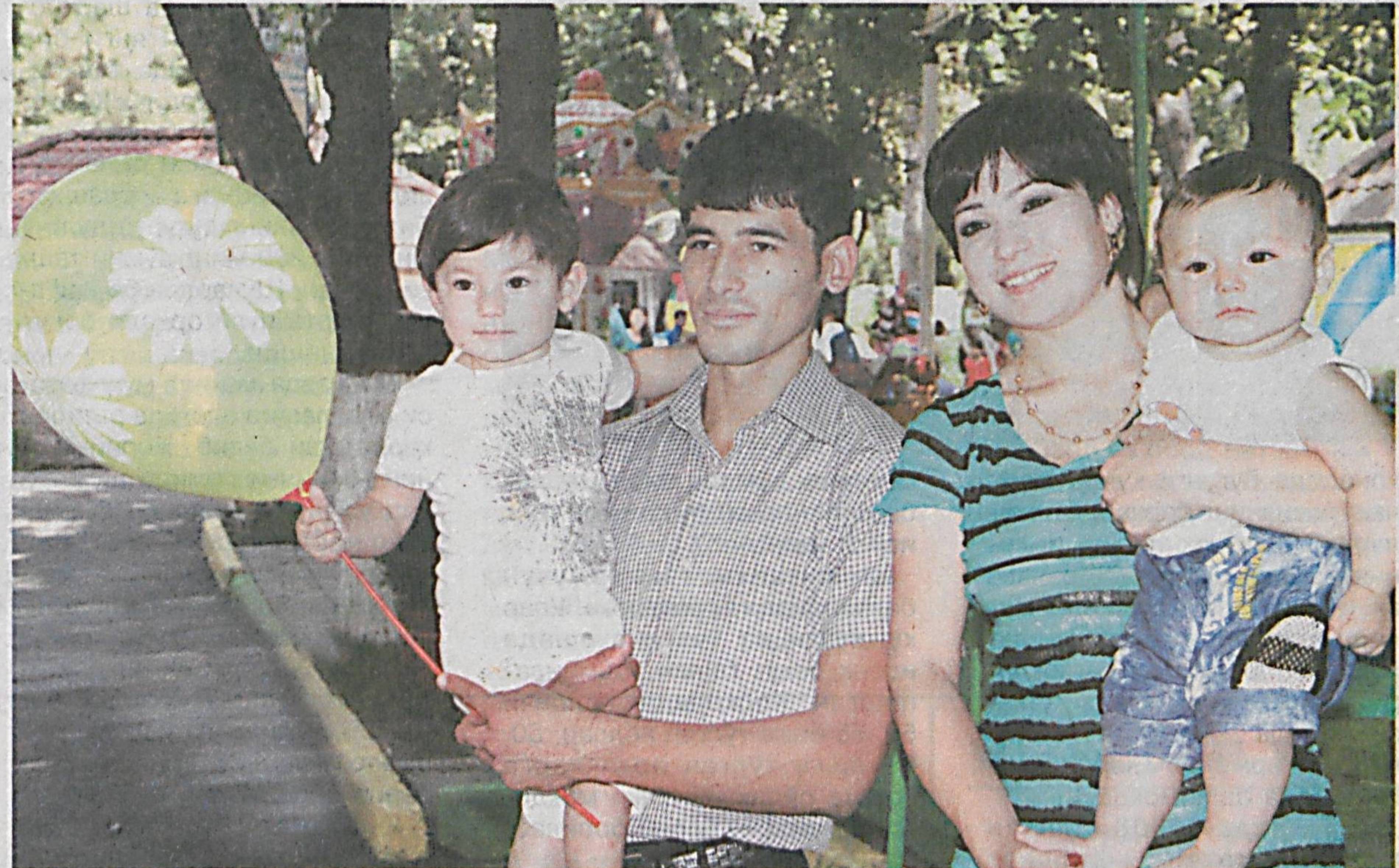
Айни кунларда ҳар бир ватандошимизнинг қалбига кўтаринки қайфият ҳукмрон. Обод турмуш йили муносабати билан мамлакатимизда аҳоли турмушини янада фаровонлаштириш, юрт ободлиги йўлида амалга оширилаётган улкан ишлар барчага балан раҳ бағишлайтир.

«Қадр-қимматим, таянчим ва ифтихоримсан, мустақил Ўзбекистон!» шiori остида ўтаётган тадбирларда эса халқимиз истиқлол берган имкониятларнинг беқисс аҳамиятини дилдан ҳис этмоқда. — Шаҳару кишлоқларимиз кундан-кунга чирой