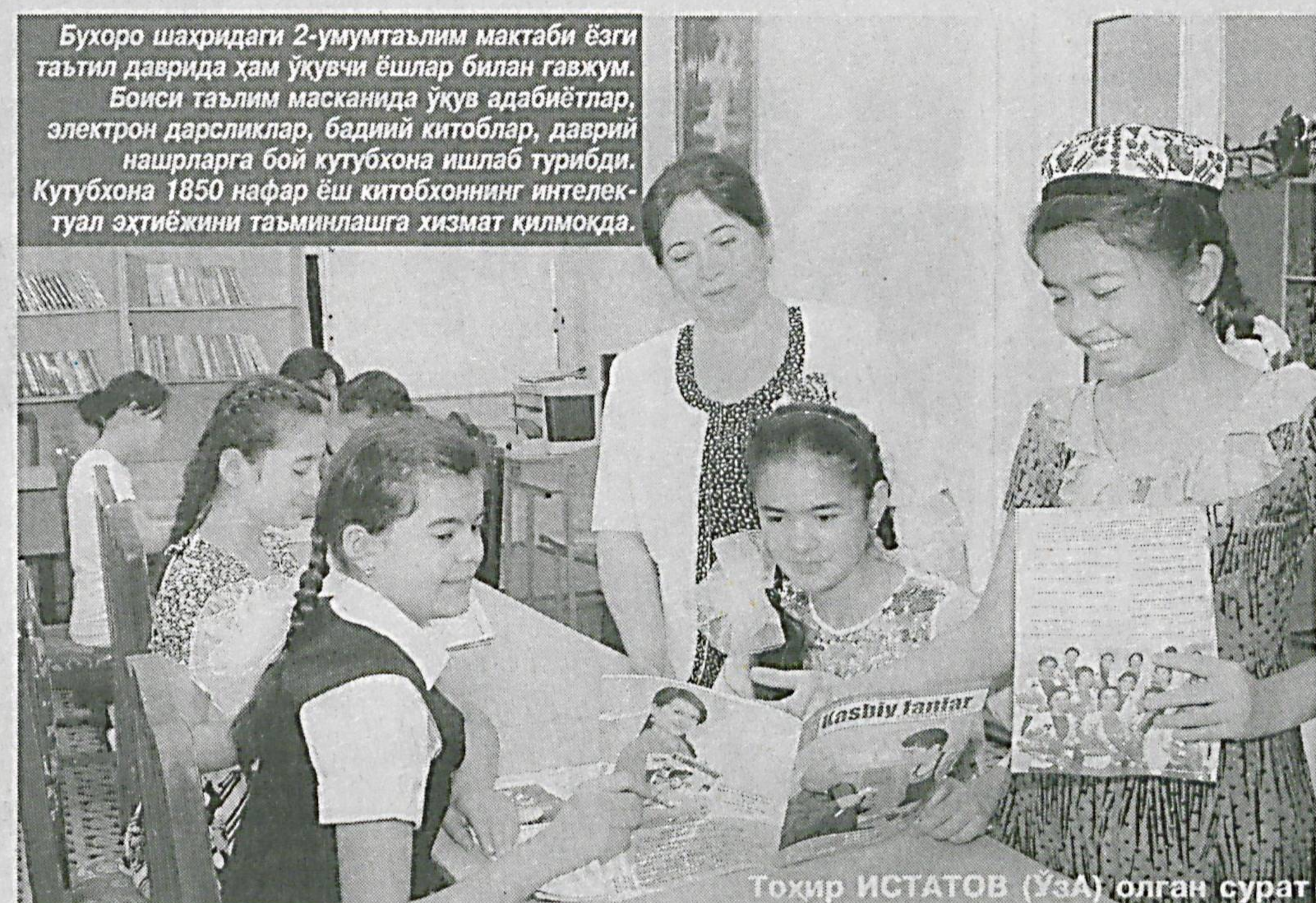
Бухоро шаҳридаги 2-умумтаълим мактаби ёнги таътил даврида ҳам ўқувчи ёшлар билан гавжум. Бонси таълим мактабида ўқув адабиётлар, электрон дарслиқлар, баъдий китоблар, даврий нашрларга бой кутубхона ишлаб турибди...