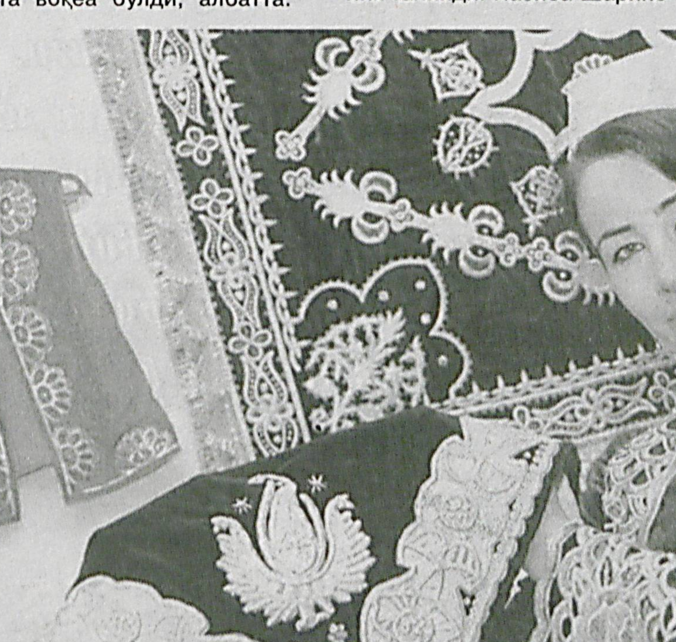
(Давоми. Бошланиши 1-саҳифада).

Самарқанд дунё шаҳарлари орасида ўзига ҳош нуфузга эга. Кўҳна диёрни кўриш истагида таширф буорайтганлар сони кундан-кунга ошиб бораётти. Тарихий шаҳарда касаба уюшмаларининг меҳмонхонаси курилиб, ишга туширилиши катта воқеа бўлди, албатта.