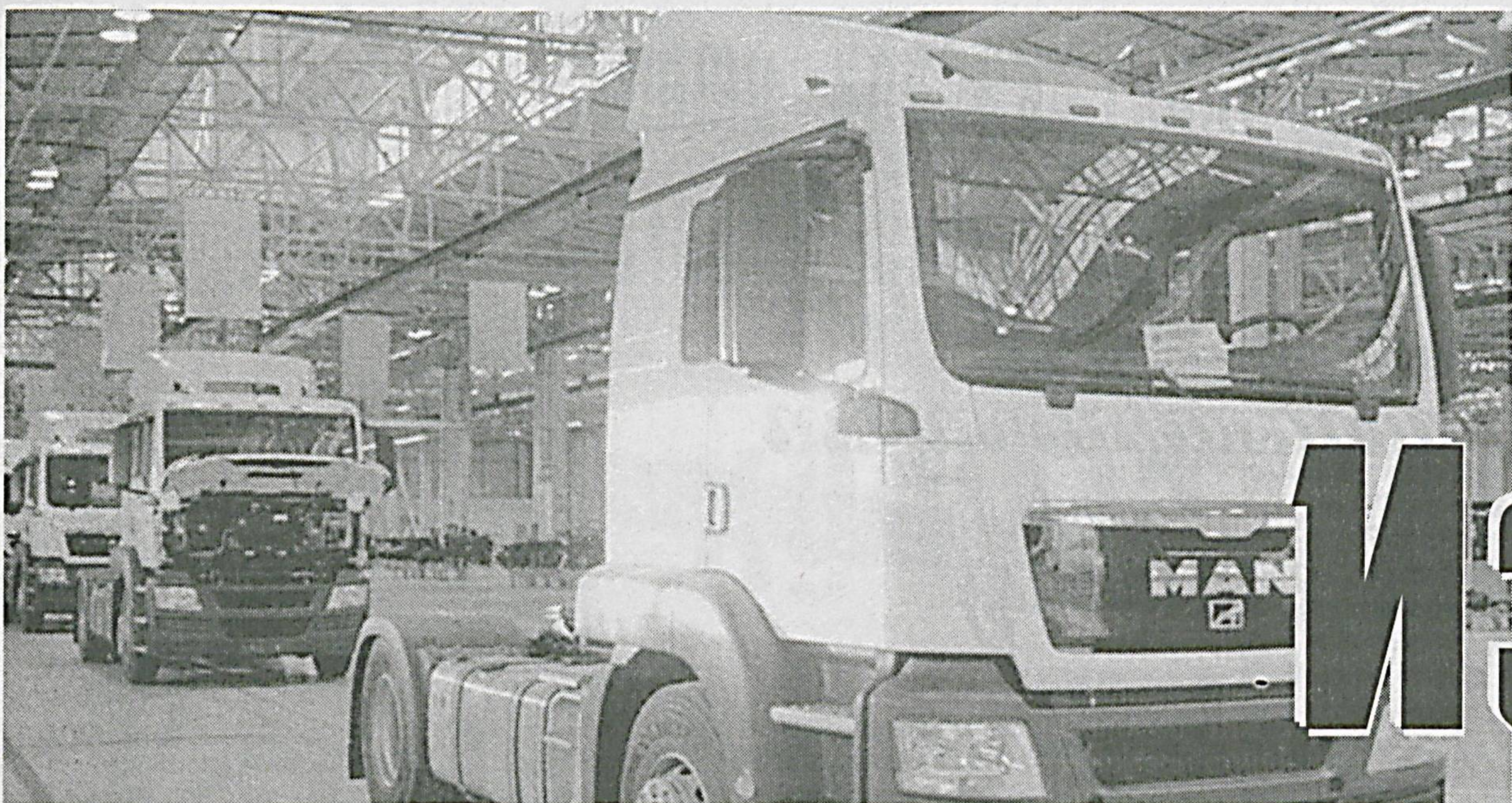
(Давоми. Бошланиши 1-саҳифада).