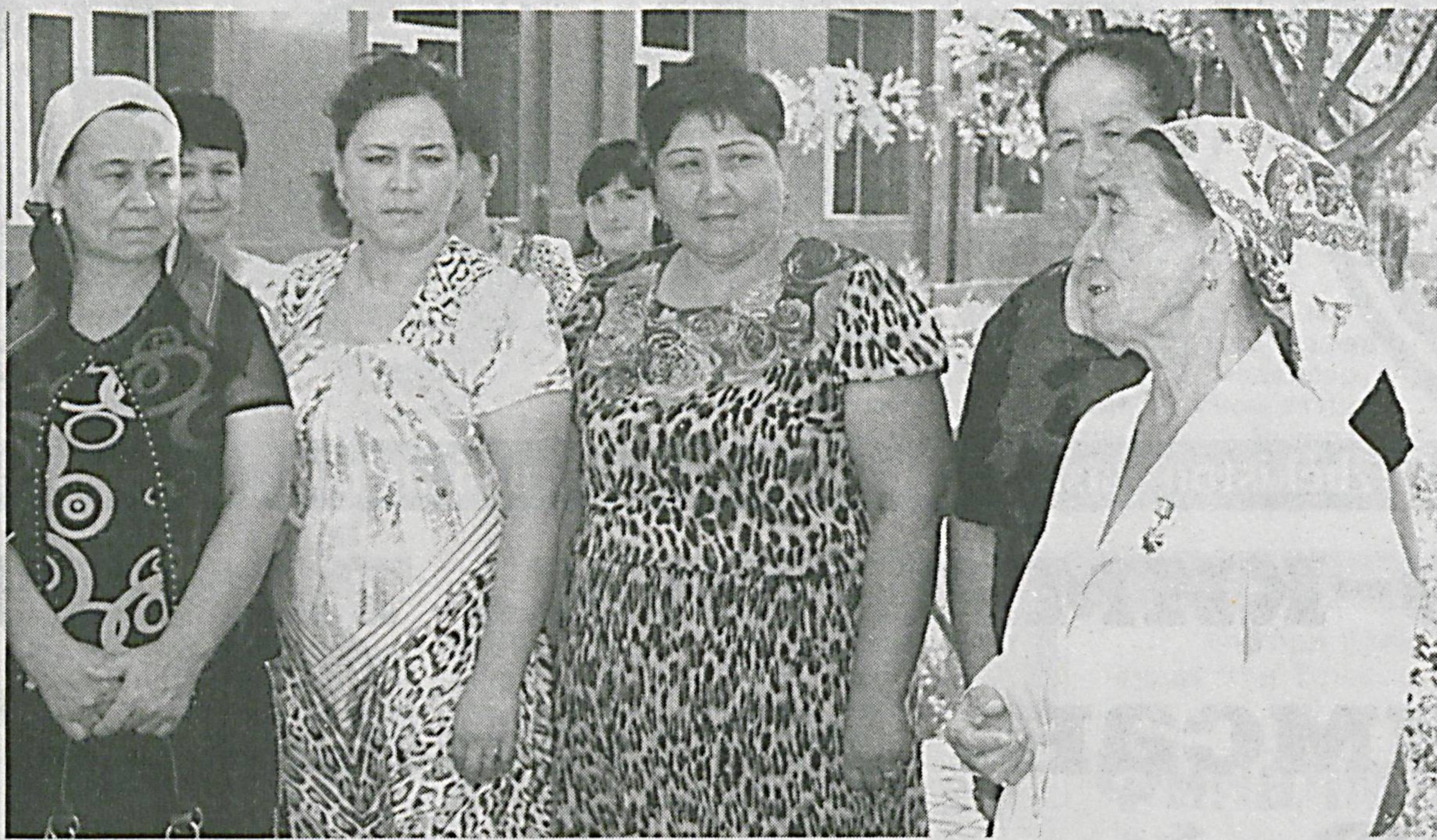
(Давоми. Бошланиши 1-саҳифада).