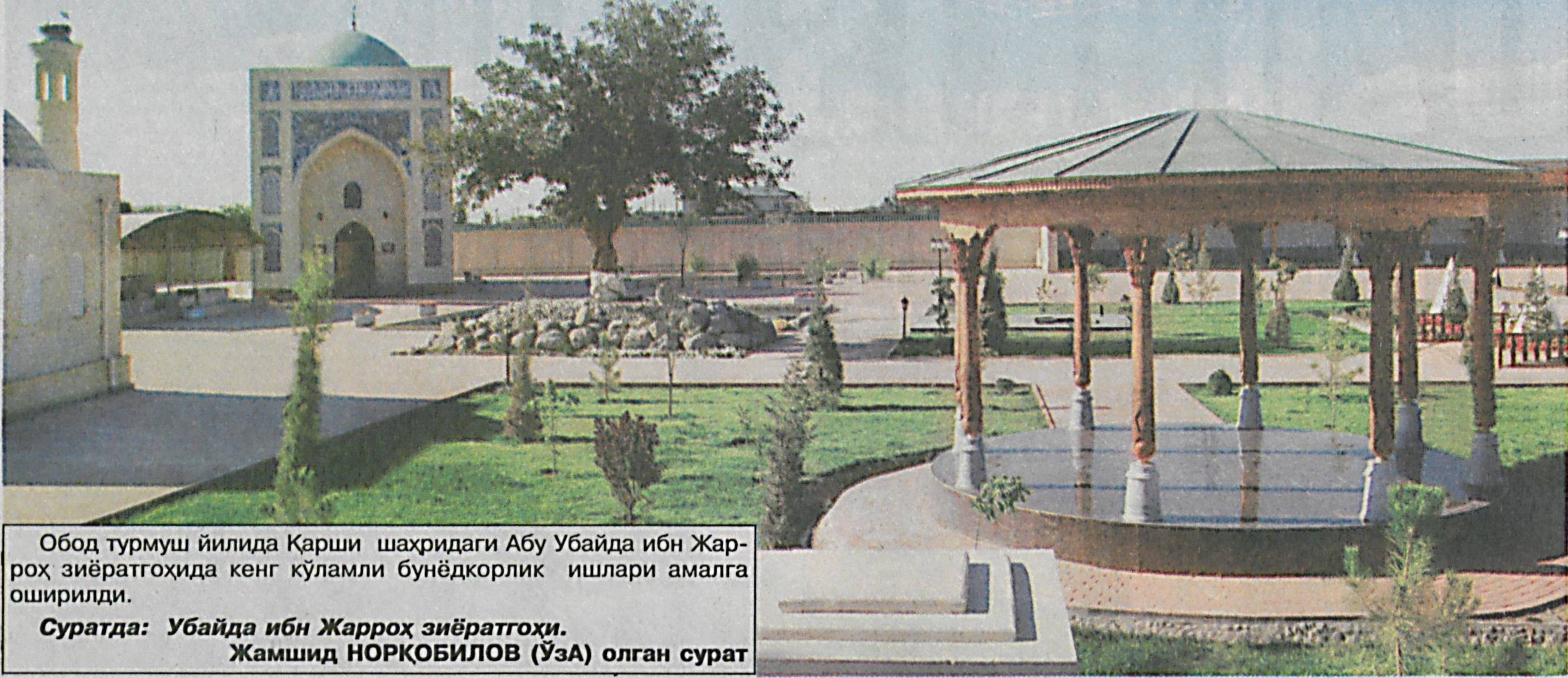
Обод турмуш йилида Қарши шаҳридаги Абу Убайда ибн Жарроҳ зиёратгоҳида кенг қўламли бунёдкорлик ишлари амалга оширилди.