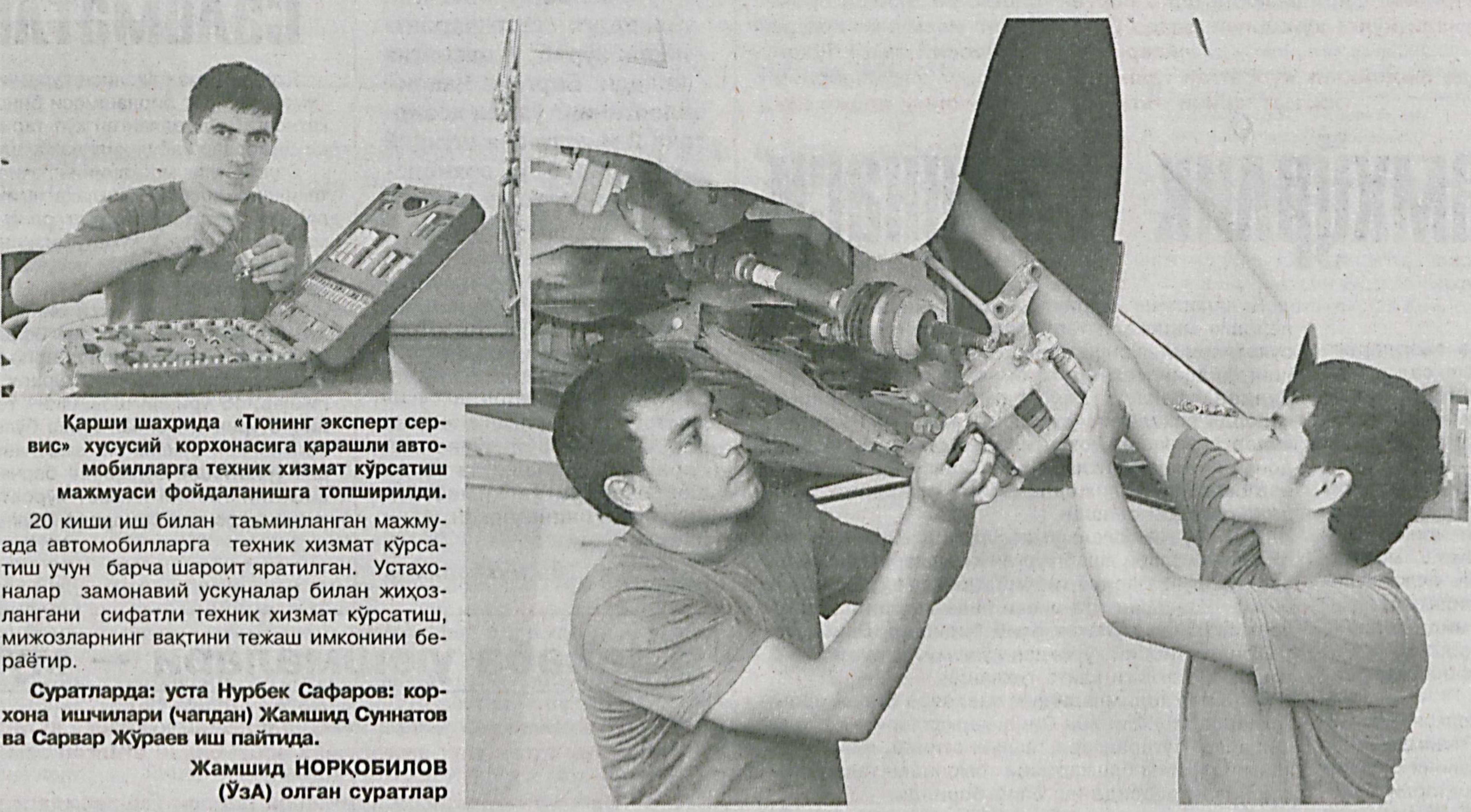
Қарши шаҳрида «Тюнинг эксперт сервис» хусусий корхонасига қарашли автомобилларга техник хизмат кўрсатиш мажмуаси фойдаланишга топширилди.