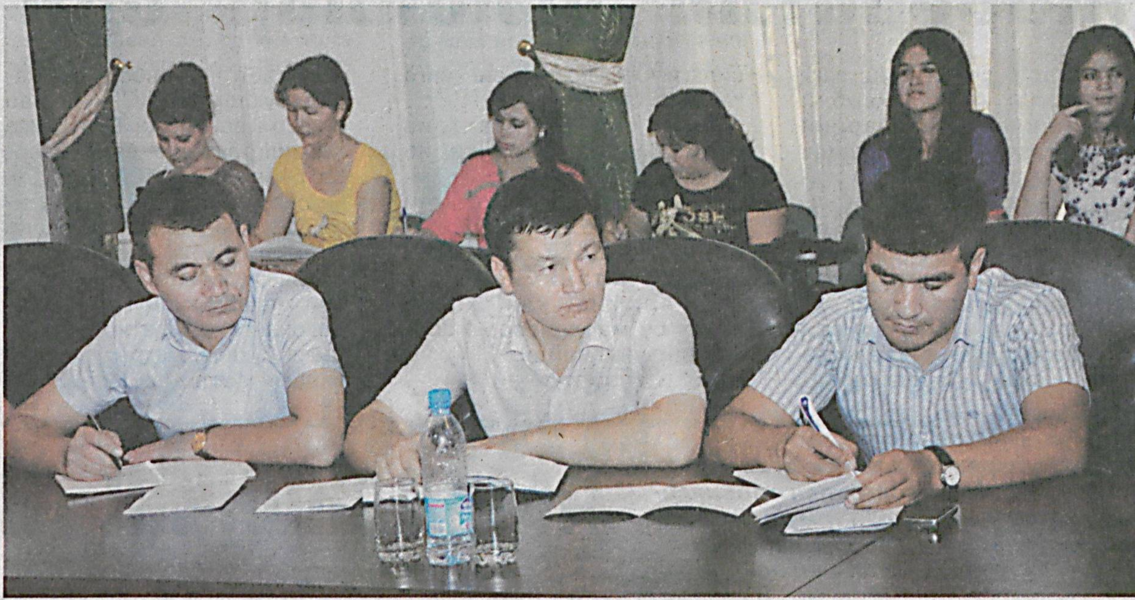
Кувонарли томони, бу йил ихтисослаштирилган оромгоҳлар сони орттириш баробарида, йўналишлари кўпайишига ҳам эришилди.

Ўзбекистон касабаси уюшмалари Федерацияси Кенгаши томонидан «Болаларни ёзги соғломлаштириш