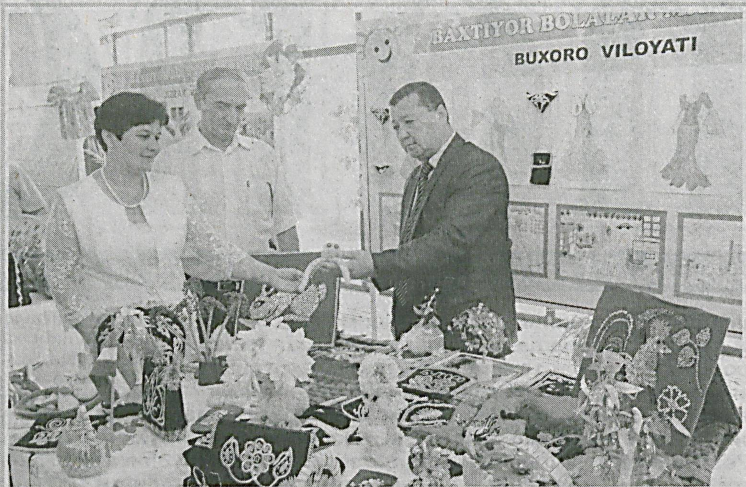
(Давоми. Бошланғич ташкилотчи).

Мамлакатимизда Болаларни дам олдириш ва соғломлаштириш бўйича Республика Мувофиқлаштирувчи гуруҳининг ташкил этилиши ижтимоий шериклик асосида давлат ва нодавлат нотижорат ташкилотларининг мазкур йўналишдаги фаолияти уйғунлигини таъминлади. Ўзбекистоннинг бошқа мамлакатларга хос бўлмаган тажрибаси, яъни болаларни сифатли дам олдириш ва соғломлаштиришни таъминлашга давлат ва нодавлат нотижорат ташкилотларини ҳам фаол жалб этиш амалиёти бугун ўзининг ижобий самарасини бермоқда.