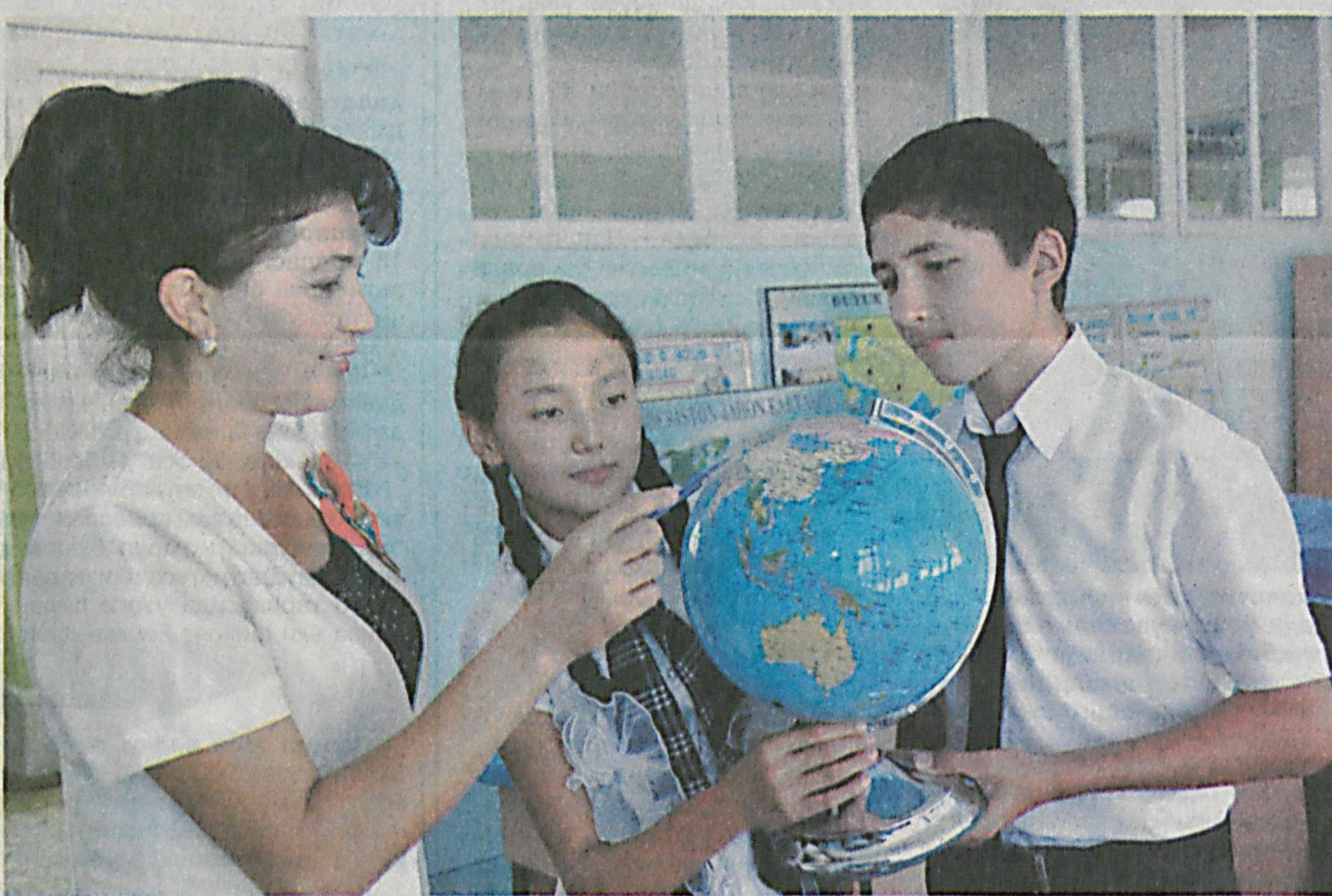
Давлатимиз раҳбарининг 2012 йил 10 декабрда қабул қилинган «Чет тилларни ўрганиш тизимини янада такомиллаштириш чора-тадбирлари тўғрисида»ги Қарори ушбу йўналишда таълим сифати ва самардорлигини изчил оширишда муҳим омил бўлмоқда. Бунини Наманган вилояти Поп туманидаги 11-сонли Давлат ихтисослаштирилган умумтаълим мактаб-интернати фаолияти мисолида ҳам кўриш мумкин.

Бу ерда 400 нафар иқтидорли ўқувчи инглиз тилидан ташқари математика, қилиш ва биология фанларини чуқур ўрганмоқда. Мактаб-интернатнинг фан, лаборатория ва компютер хоналари, спорт зами, ётоқхона, ошхона, кутубхона, ташхис маркази ва тиббий хоналари замонавий усулда жиҳозланган.