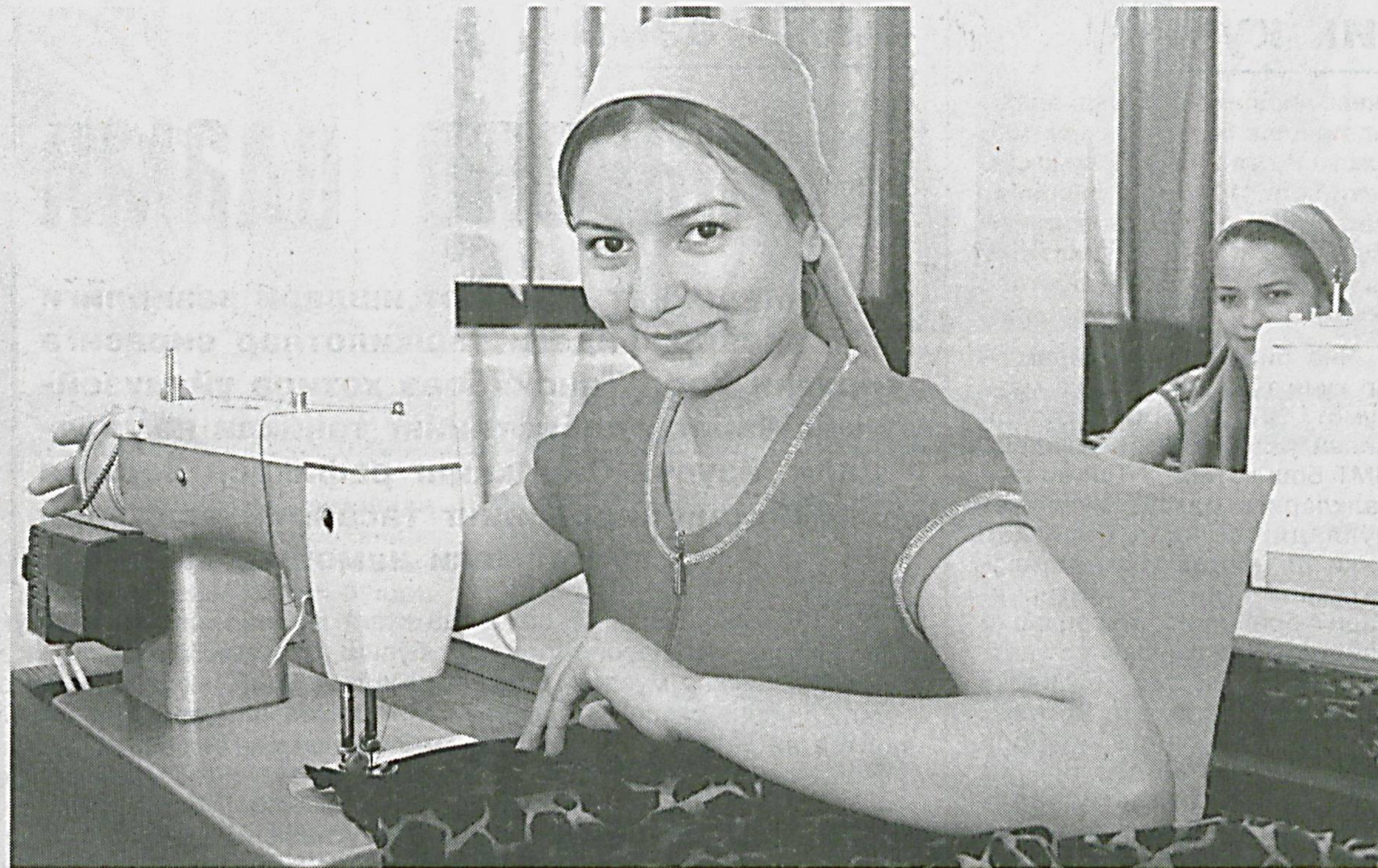
Навоий шаҳридаги «Рухсона — Нозима — Моҳина» масъулияти чекланган жамиятида йигирмага яқин хотин-қиз иш билан таъминланган.

Ҳ. ФОЗИЛОВ, Жиззах шаҳар ҳокимлиги Ахборот хизмати раҳбари