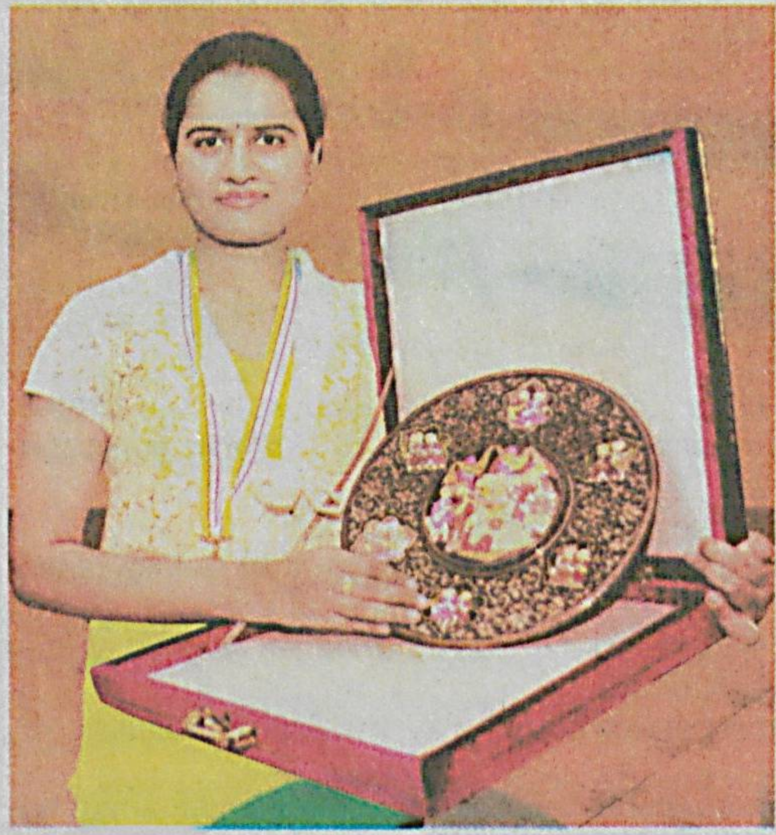
Хотин-қизлар ўртасидаги олти халқаро турнирдан иборат ФИДЕ Гран-при...

Ўзбекистон Тасвирий санъат галереясида Халқаро шахмат федерацияси, мамлакатимиз шахмат федерацияси ҳамда «Ўзбекистон маданияти ва санъати форуми» жамғармаси ҳамкорлигида ташкил этилган хотин-қизлар ўртасидаги ФИДЕ Гран-присининг учинчи босқич баҳслари нихосига етди.