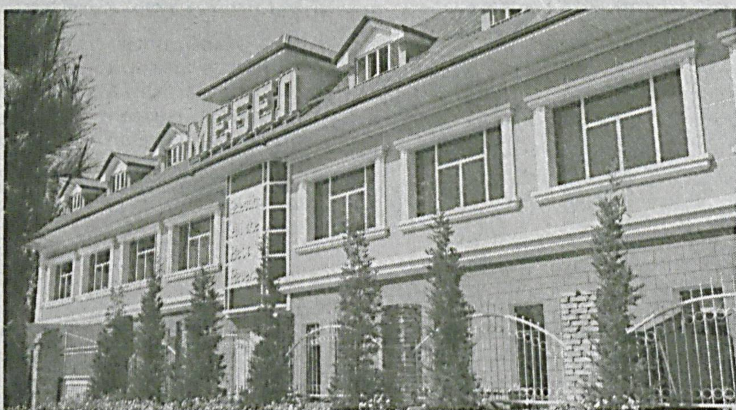
Фаргона вилояти Ўзбекистон туманидаги «Selection of All the Best Revere» хусусий корхонаси асосан ётоқхона ва меҳмонхона, идора мебелларини ишлаб чиқаришга ихтисослашган.

Умуман 45 дан ортиқ маҳсулот истеъмолчиларга етказиб берилмоқда. Фаолиятнинг дастлабки даврида ишчилар сони 5 нафарни ташкил қилган корхонада ҳозир 18 нафар ишчи меҳнат қилмоқда. Жорий йилда касб-хунар коллежларини битирган ўқувчилардан 2 нафари доимий иш билан таъминланди.