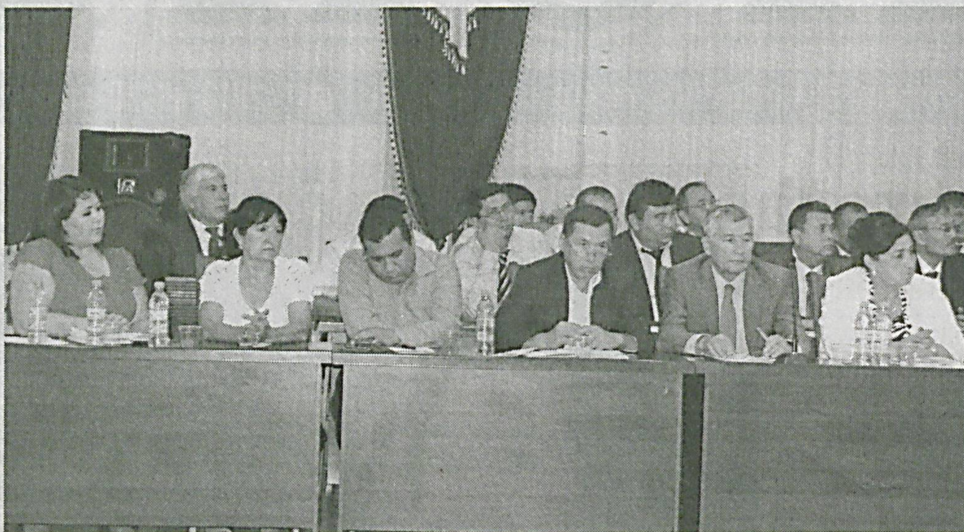
(Давоми. Бошланиши 1-саҳифада).

Ижтимоий шериклини ривожлантириш масаласи касба уюшмаларининг доимий эътиборида бўлиб, бунда Бош келишув, тармоқ ва ҳудудий келишувлар ҳамда жамоа шартномалари мазмун-моҳиятини замон талабига мос равишда бойитиш, уларнинг таъсирчанлигини ошириш ҳамда қатъий бажарилишига эришиш вазифалари устуворлик касб этапти. Ҳозирда республикада 1 та Бош келишув, республика миқёсдаги 86 та тармоқ келишув, Қорақалпоғистон Республикаси, вилоятлар ва Тошкент шаҳри миқёсда 14 та ҳудудий келишув, бевосита корхона ва ташкилотларда эса 93 миң 805 та жамоа шартномаси амал қилмоқда. Касаба уюшмалари аъзолари меҳнатидан фойдаланувчи юридик шахсларнинг 95,8 фоизи жамоа шартномавий муносабатлар билан қамраб олиншига эришилган.