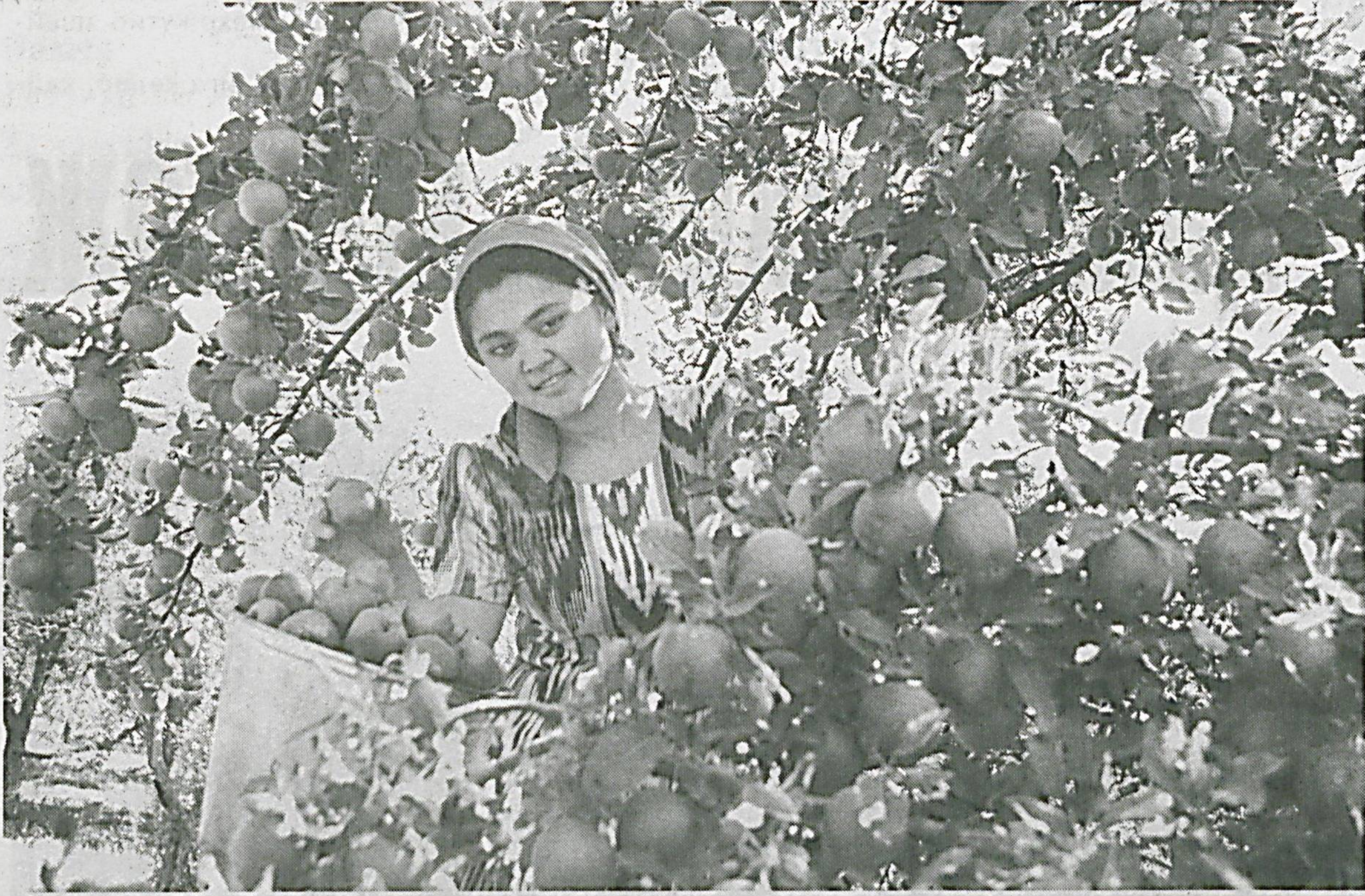
Наманган вилоятининг Янгиқўрғон тумани асосан мева-сабзавотчиликка ихтисослаштирилган. Туманда 8317 гектар боғлар мавжуд бўлиб, шунинг 1933 гектарини ҳосилга кирмаган боғлар ташкил этади. 2012 йилда 120 гектар майдонда интенсив усулда янги боғзорлар ташкил этилиб, бу боғзорларнинг олди ҳосил бера бошлади.

Эллиқалъа туманидаги Амир Темур номи ботаника боғида бўлган кишининг баҳри дили ёришади. Ҳозир бу ерда 370 дан зиёд ўсимлик турлари мавжуд. 25 гектар майдон дендро флорага ажратилиб, географик томоилга асосан уч йўналишда дароҳ ва буталар, тропик ва субтропик, доривор ва бўёқсимон ўсимликлар парвариш қилинмоқда.