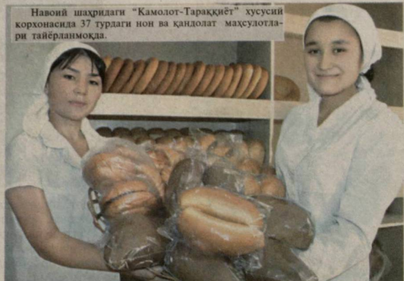
Навоий шаҳридаги "Камолот-Тараққиёт" хусусий корхонасида 37 турдаги нон ва қандолат маҳсулотлари тайёрланмоқда.

Дарҳақиқат, мустақиллик йилларида Навоий вилоятида ҳам юксак тараққиётга етакловчи муҳим стратегик чораларни амалга ошириш,