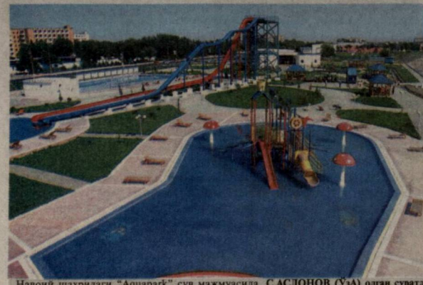
Навоий шаҳридаги "Ақсарғок" сув мажмуасида.