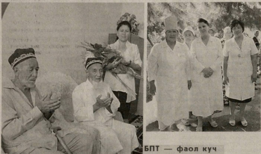
БПТ — фаол куч