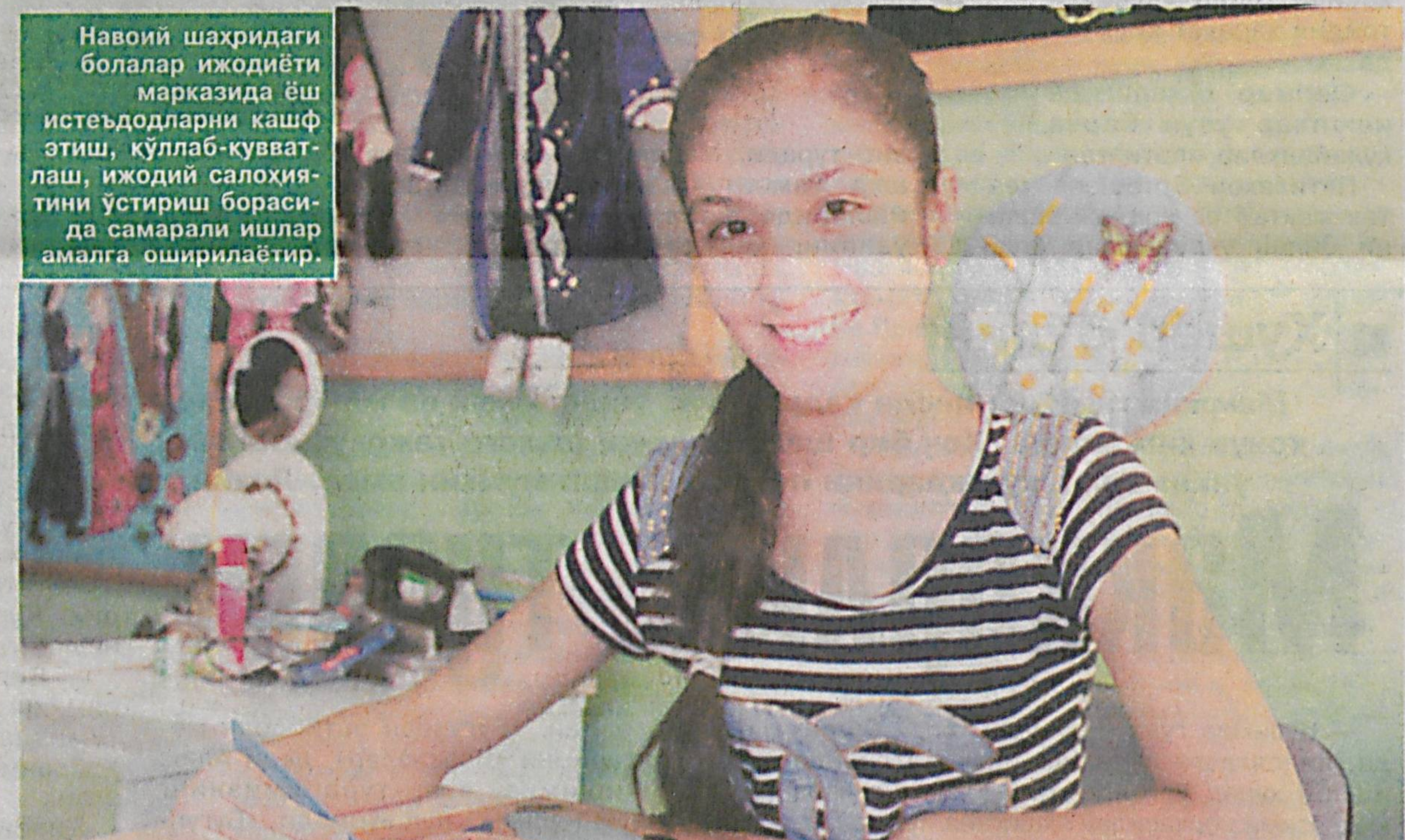
Навоий шаҳридаги болалар ижодиёти марказида ёш истеъодларни кашф этиш, қўллаб-қувватлаш, ижодий салоҳиятини ўстириш борасида самарали ишлар амалга ошириляётган.