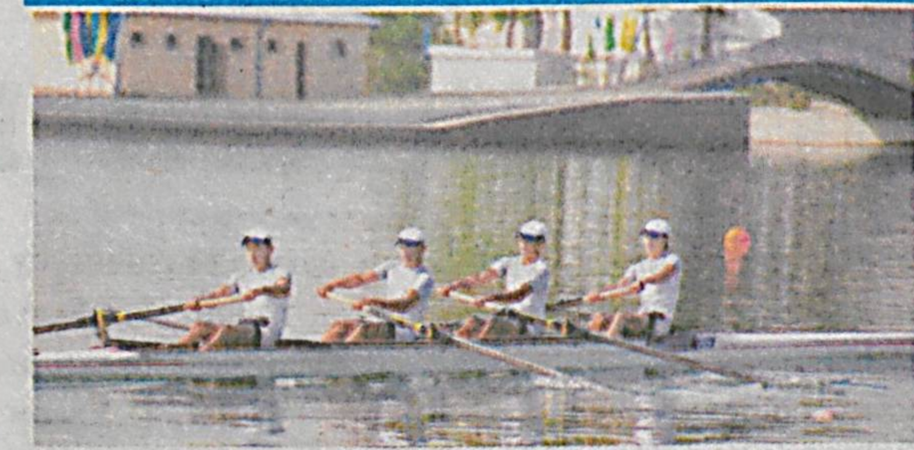
Самарқандда академик эшак эшиш бўйича эшак ўртасида XIX Осиё чемпионати якунланди.