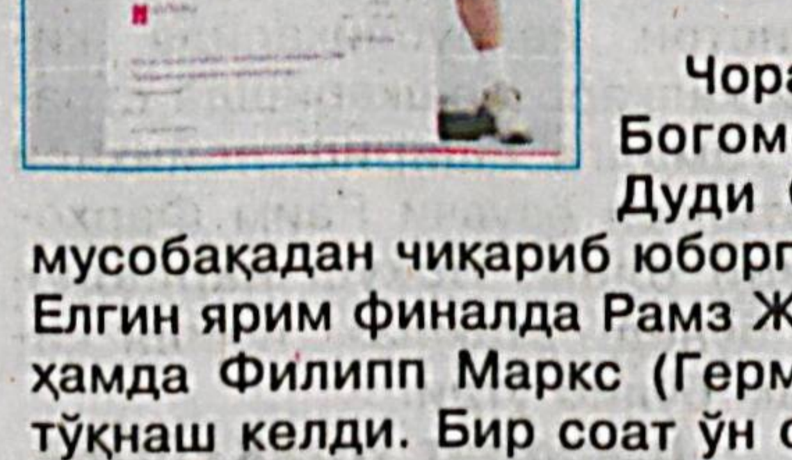
Чорак финалда Алекс Богомолов (Россия) ва Дуди Села жуфтлигини мусобақадан чиқариб юборган Истомин ҳамда Елгин ярим финалда Рамз Жунайд (Австралия) ҳамда Филипп Маркс (Германия) жуфтлигига тўқнаш келди. Бир соат ўн олти дақиқа давом

этган учрашув иккала жуфтлик учун ҳам оғир кечди. Якуний ҳисоб — 5:7, 6:3, 10:5 — бизнинг фойдамизга.