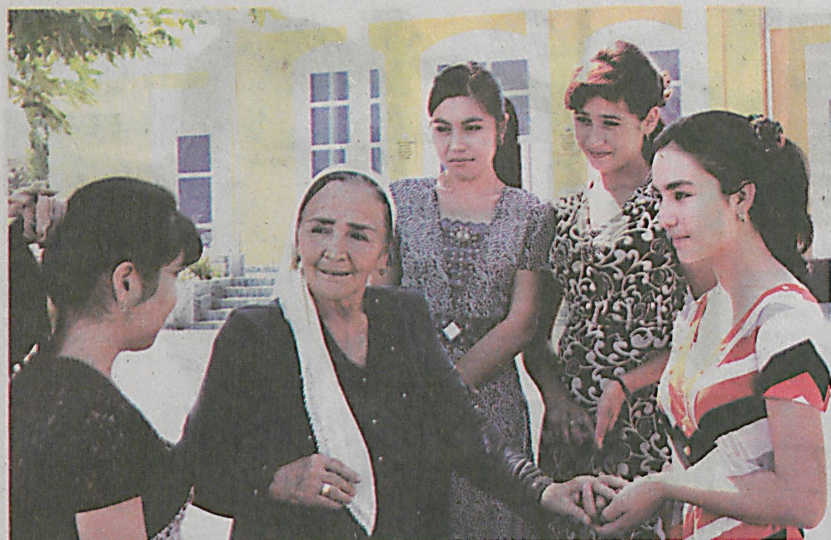
Ўзбекистон тумани ҳокимлиги ташаббуси билан туман маънавият тарғибот маркази, ФХД, «Нуроний» жағфармаси, «Камолот» ёшлар ижтимоий ҳаракати ходимларидан ташкил топган Тарғибот гуруҳи бир неча йилдан буён намунали иш олиб бормоқда.

Улар мактаб, коллеж, академик лицей ҳамда корхона, ташкилотларда бўлиб, диний экстремизм, одам савдоси, ёшларни турмушга тайёрлаш ва бошқа ижтимоий масалалар бўйича суҳбатлар ўтказмоқда.