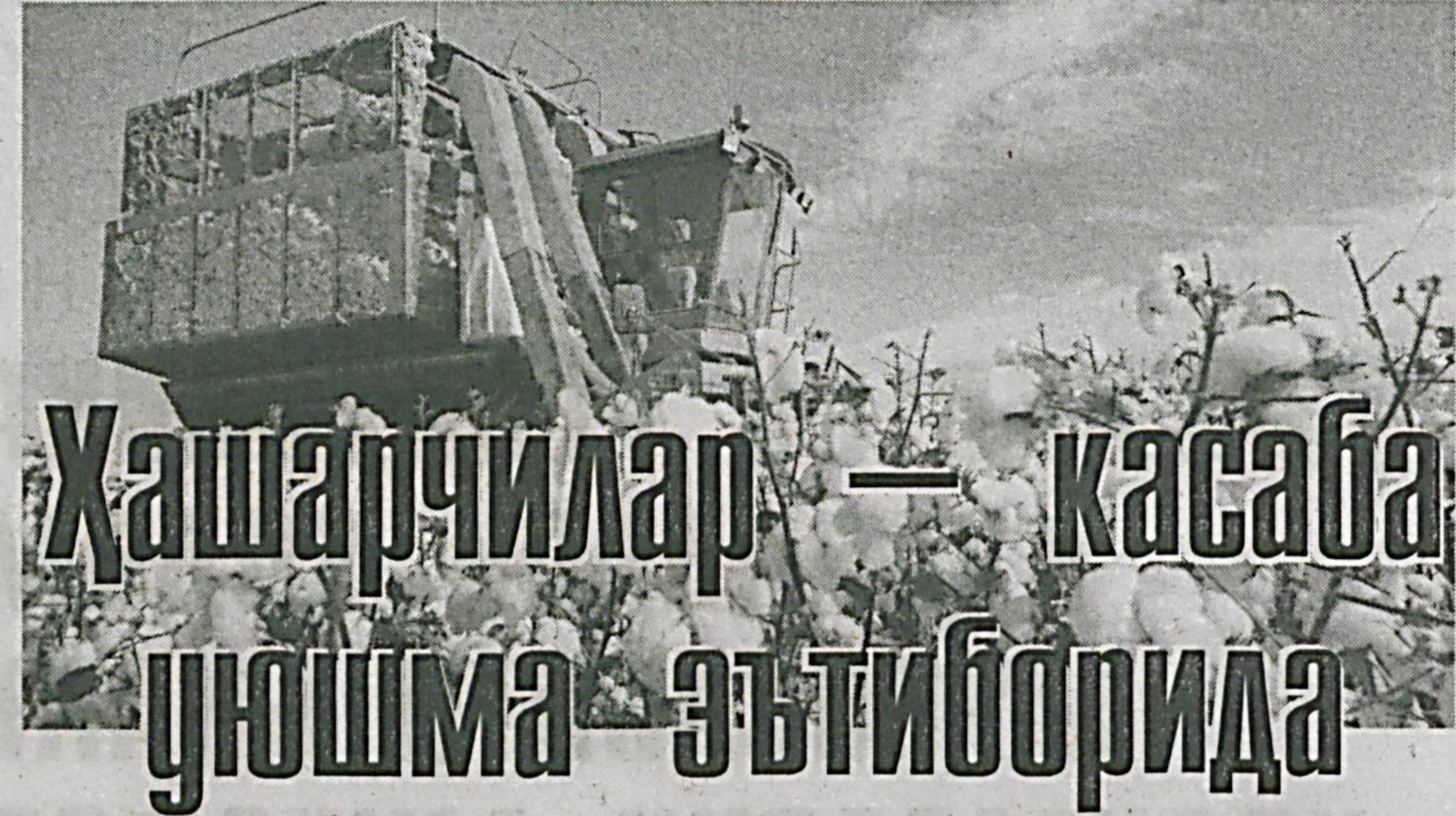
Шовот туманидаги «Шовот Ислон Шариф» фермер ҳўжалиги республикада биринчилардан бўлиб, давлатта пахта топшириш шартномасини бажарди ва Президент совғасини олишға муваффақ бўлди.

Ўзбекистон қасаба уюшмалари Федерацияси Кенгаши Раёсатининг 2013 йил 23 июлдаги «2013 йил пахта йиғим-терими мавсумиға тайёргарлик кўриш, далада ишлаётган механизаторлар, сувчилар, ишчилар ва теримчиларға шарт-шароитлар яратиш, мавсум даврида болалар меҳнатидан фойдаланмаслик чора-тадбирлари тўғрисидаги қарори ижросини таъминлаш борасида амалга оширилайтган ишлар меҳнаткашлар манфаатини ҳўмоялашда муҳим аҳамият касб этмоқда.