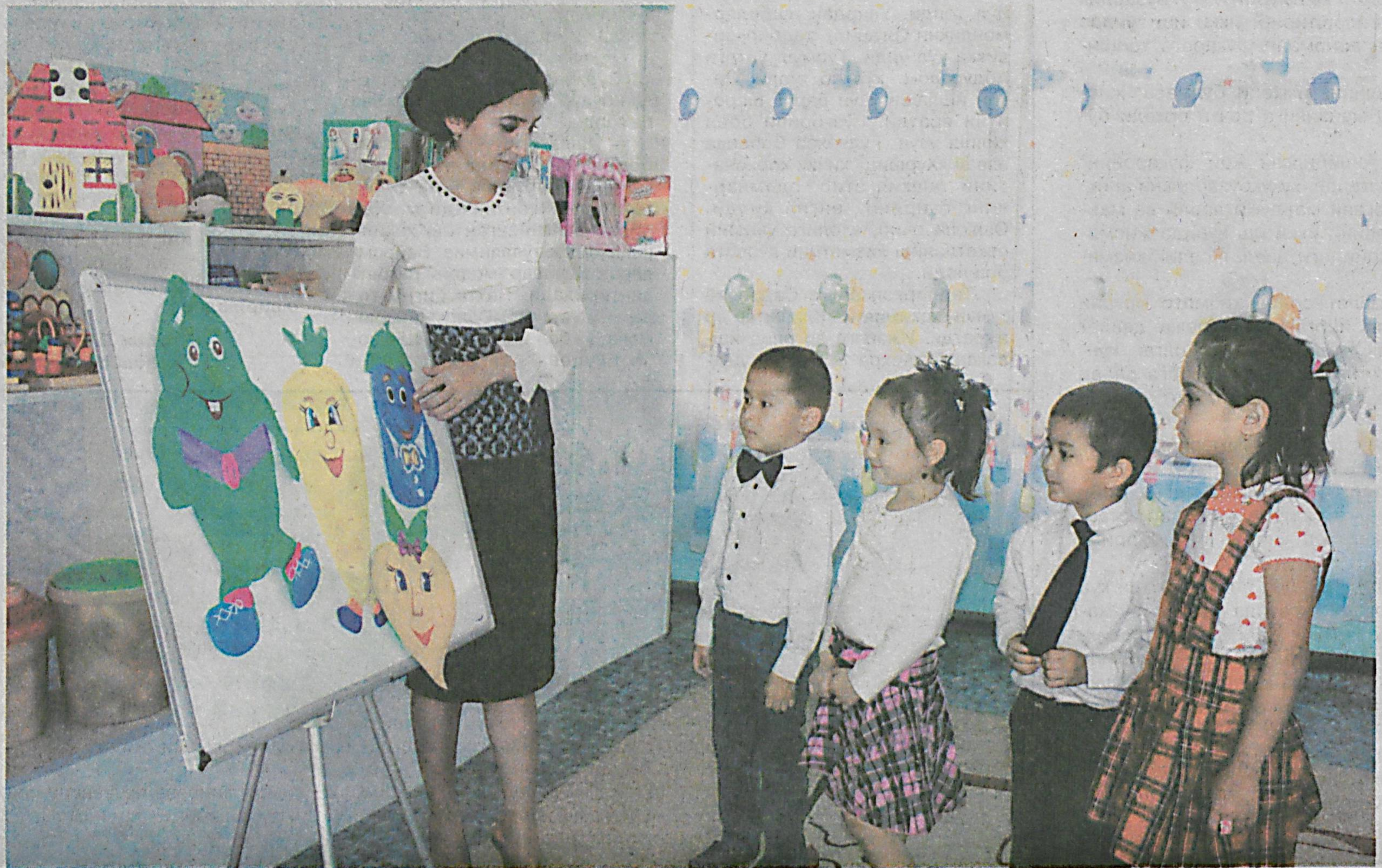
Навоий шаҳридаги 20-мактабга таълим муассасида тарбияланувчиларга замонавий андазалар асосида инглиз тили ўргатишмоқда.

Президентимизнинг 2012 йил 10 декабрда қабул қилинган «Чет тилларни ўрганиш ти-