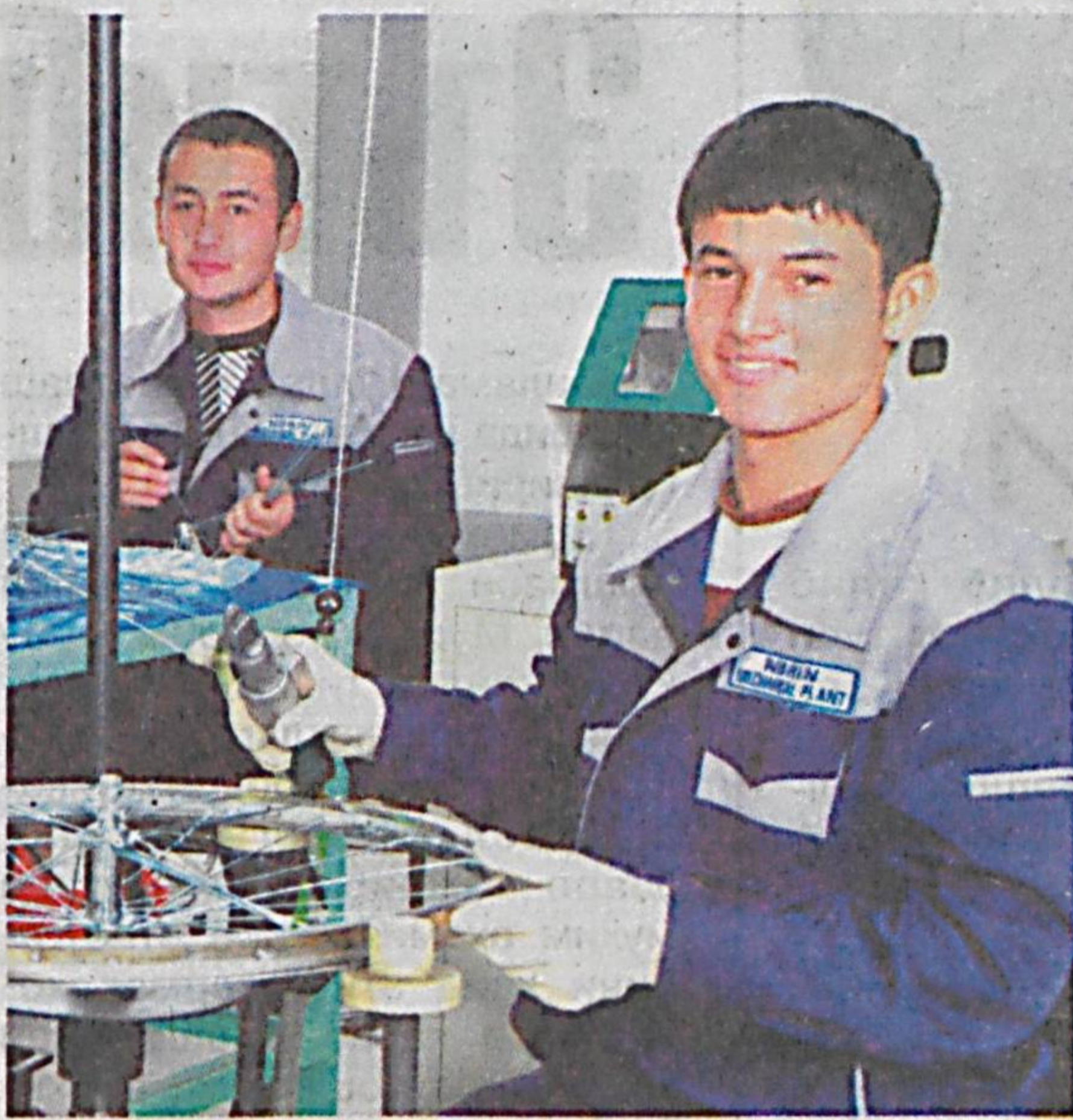
Наманган вилоятининг Норин туманидаги «Norin mechanical plant» масъулияти чекланган жамиятида велосипедлар учун рама ва вилкалар ишлаб чиқарадиган янги цех ишга тушди.