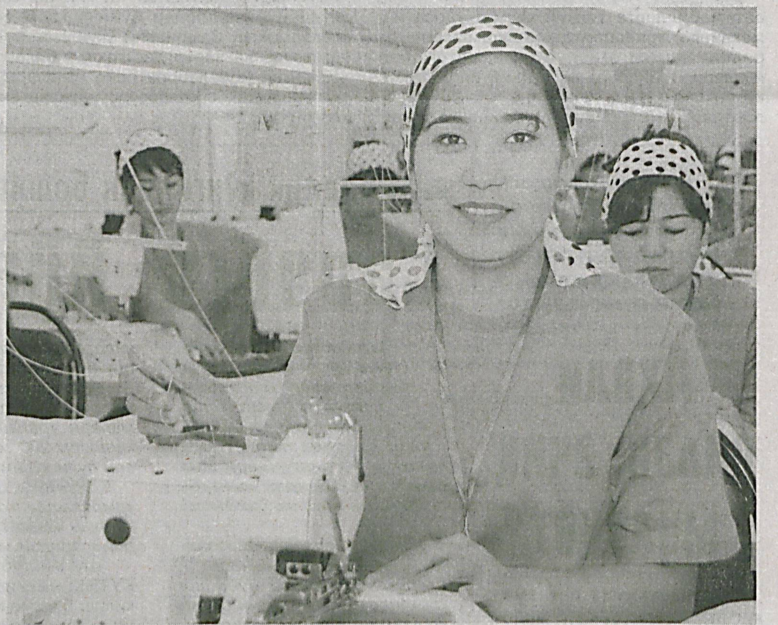
Сурхондарё виллоятининг Жарқўрғон туманидаги «Марказий Сурхон» маҳалласида «Ўзбекнегро» давлат акциядорлик компаниясига қарашли «Савдоэнегро» акциядорлик жамияти томонидан барпо этилган «Charog'on tekstil» трикотаж фабрикаси фойдаланишга топширилди.