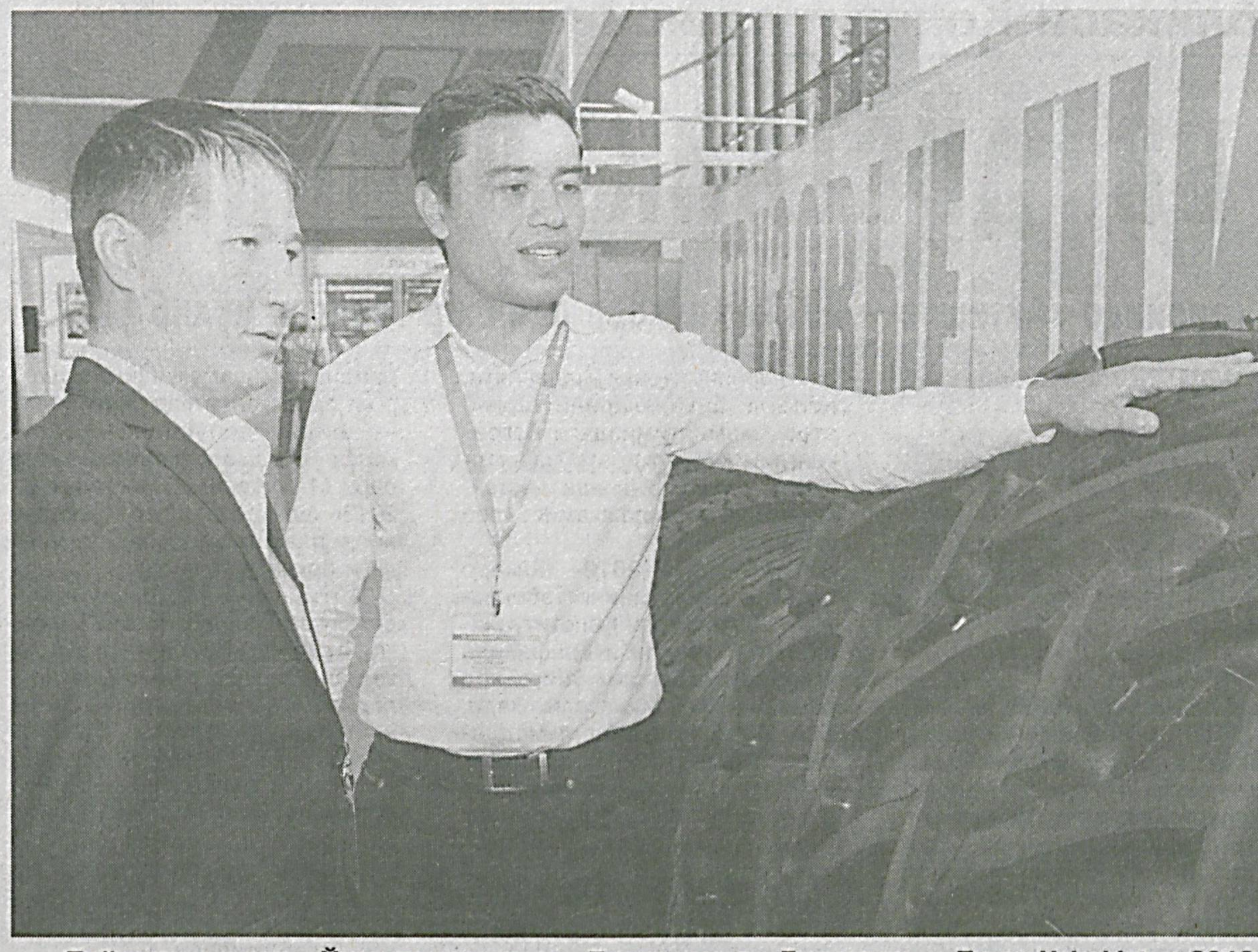
Пойтахтимиздаги «Ўзэкспомарказ»да «Транспорт ва Логистика — Trans Uzbekistan 2013» 10-, «Автомобиллар, бутловчи қисмлар, сервис ускуналари — Auto&Parts Uzbekistan 2013» 9-, «Йўл қурилиши ва коммунал техника UzComak 2013» 5-Ўзбек халқаро кўргазмалари бўлиб ўтди.

Транспортда юк ташиш, автосервис ва йўл қурилиши масалалари уйғунлиги кўргазмалари ўзаро бирлаштирган асосий жиҳат сифатида кўзга ташланди.