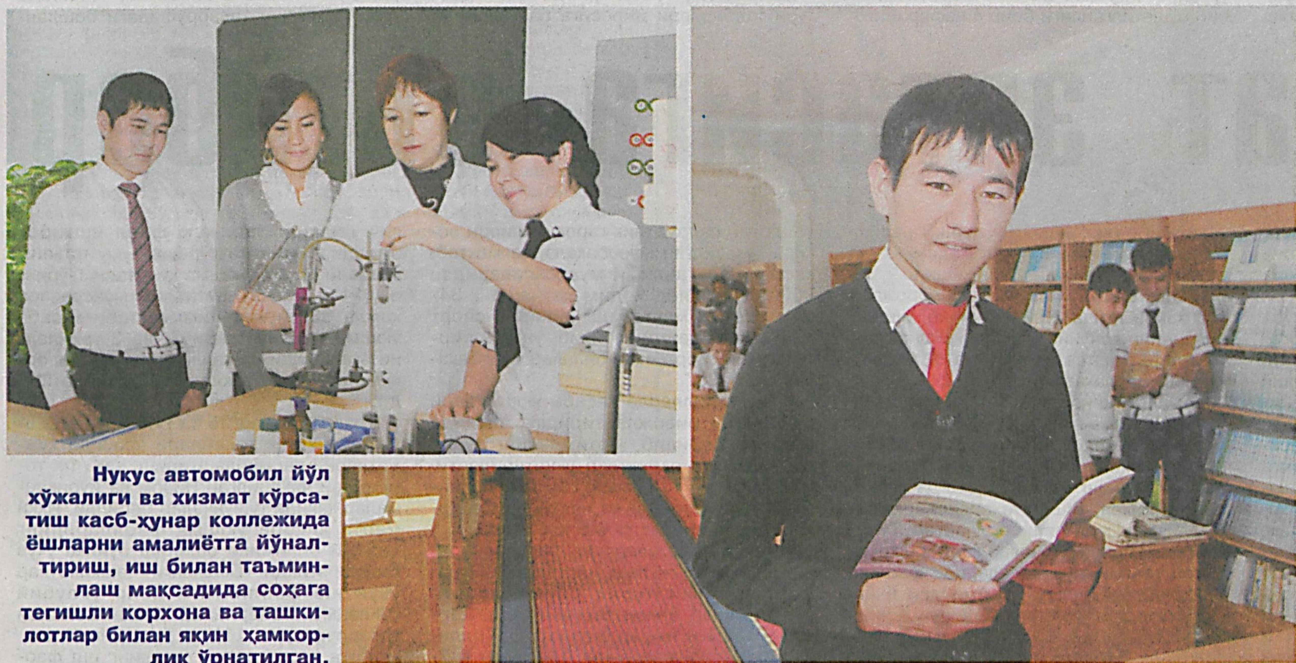
Нукус автомобил йўл хўжалиги ва хизмат кўрсатиш касб-хунар коллежида ёшларни амалиётга йўналтириш, иш билан таъминлаш мақсадида соҳага тегишли корхона ва ташкилотлар билан яқин ҳамкорлик ўрнатилган.