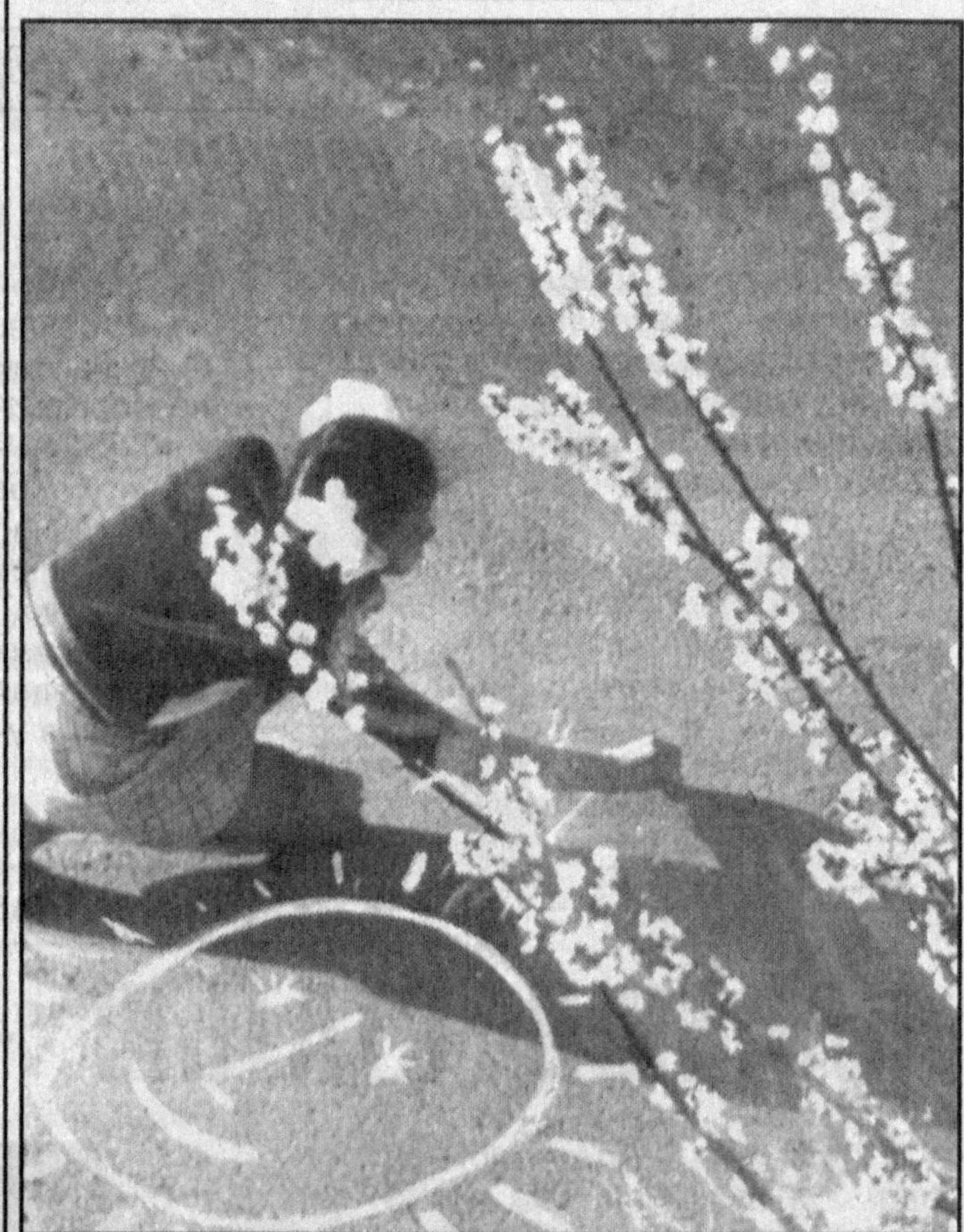
В каждом рисунке - солнце.

Частному детсаду при ООО «Маслахат ва тренинг маркази «Адолат» требуются для работы в русскоязычных группах опытные воспитательницы и помощница воспитательницы. Справки по телефону: 273-71-14, 351-34-74.