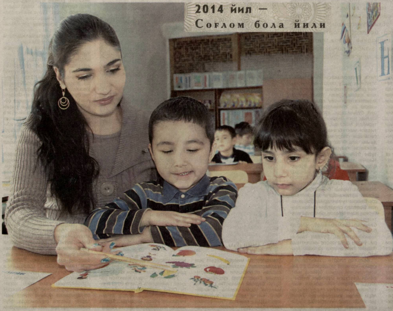
2014 йил — Соғлом бола йили

А.САМАДОВ, Х.МАМАТРАЙИМОВ, ЎЗА махсус мухбирлари