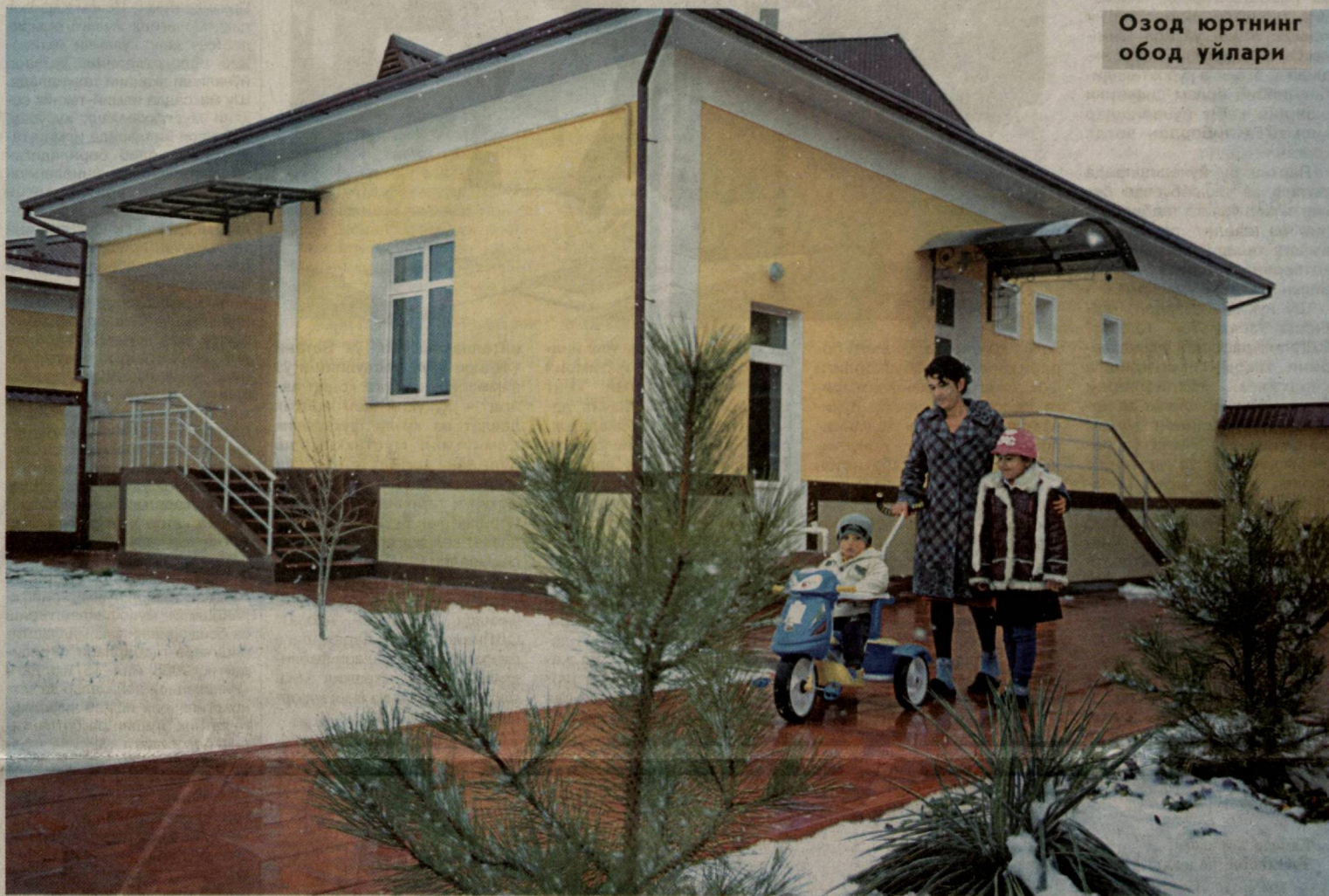
Озод юртнинг обод уйлари

Тадбир иштирокчилари шунингдек, тарғибот тадбирларининг кўпроқ партиянинг сайловолди дастуридаги энергетика тежамкорлиги ва муқобил энергия манбаларини ривожлантиришга йўналтириш билан чекланиб қолаётганлигини танқид қилдилар. Ўртбошимизнинг 2013 йил 1 мартдаги «Муқобил энергия манбаларини янада ривожлантириш чора-тадбирлари тўғрисида»ги Фармони асосида партия томонидан кўплаб тадбирлар амалга оширилди, амалий ишларга қўл урилди.