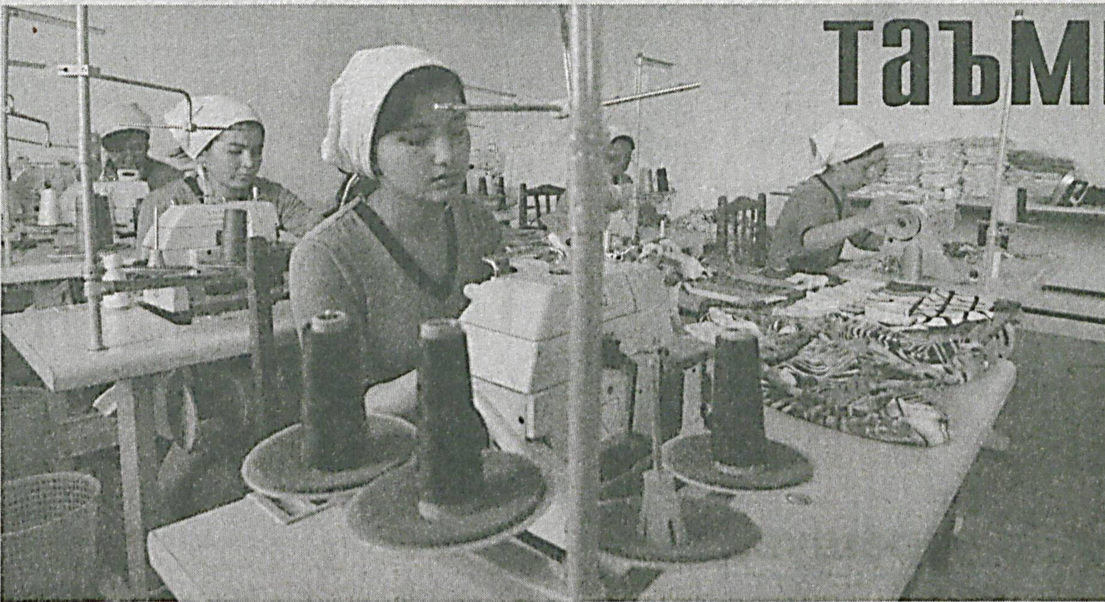
(Давоми. Бошланғич 1-саҳифада).

Маълумки, мамлакатимизда ходимлар муносиб меҳнатини таъминлаш тамойили эркин, адолатли ва хавфсиз меҳнат, меҳнат кишининг қадрлаш мезонларига асосланади. Меҳнат соҳасидаги халқаро меъёр ва тамойиллар, ходимлар ижтимоий ҳимояси қўламини кенгайтириш, давлат органлари, иш берувчилар ва ходимлар ўртасидаги муносабатлар, ижтимоий-иқтисодий масалаларни ҳал этиш борасидаги ижтимоий мулоқот самарали амалга ошириб келинмоқда.