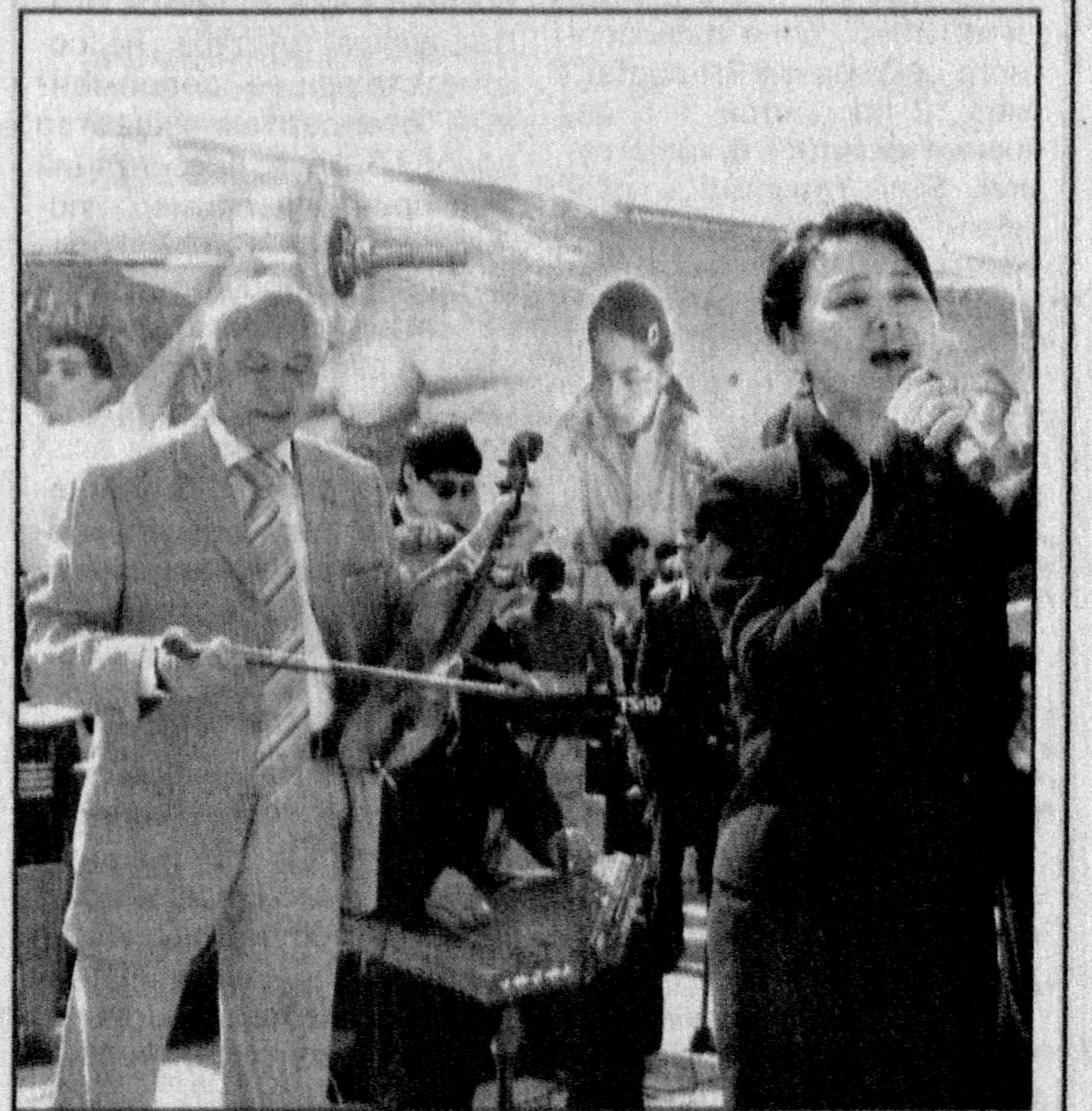
На снимках: во время празднования Навруза в областном центре «Духовность и просветительство».

Привезли свои работы и ремесленники. Чего здесь (Окончание на 2-й стр.)