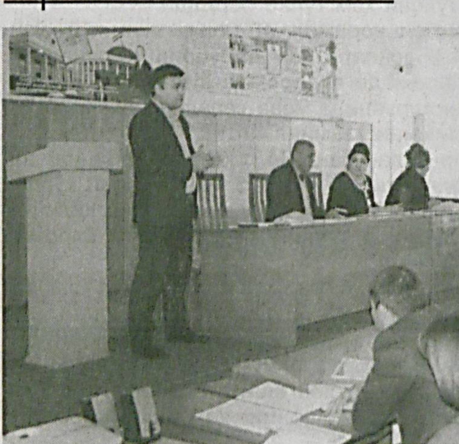
Тошкент вилоят касба уюшма ташкилотлари бирлашмаси кенгаши томонидан вилоят педагог кадрлари қайта тайёрлаш ва малакасини ошириш институтининг мажлислар залида ҳуқуқий ва ижтимоий-иқтисодий ҳимоя масалаларига оид ўқув-семинар ўтказилди. Унда фаоллар ҳамда ходимлар билан ишлаш бўлими нозирлари иштирок этдилар.