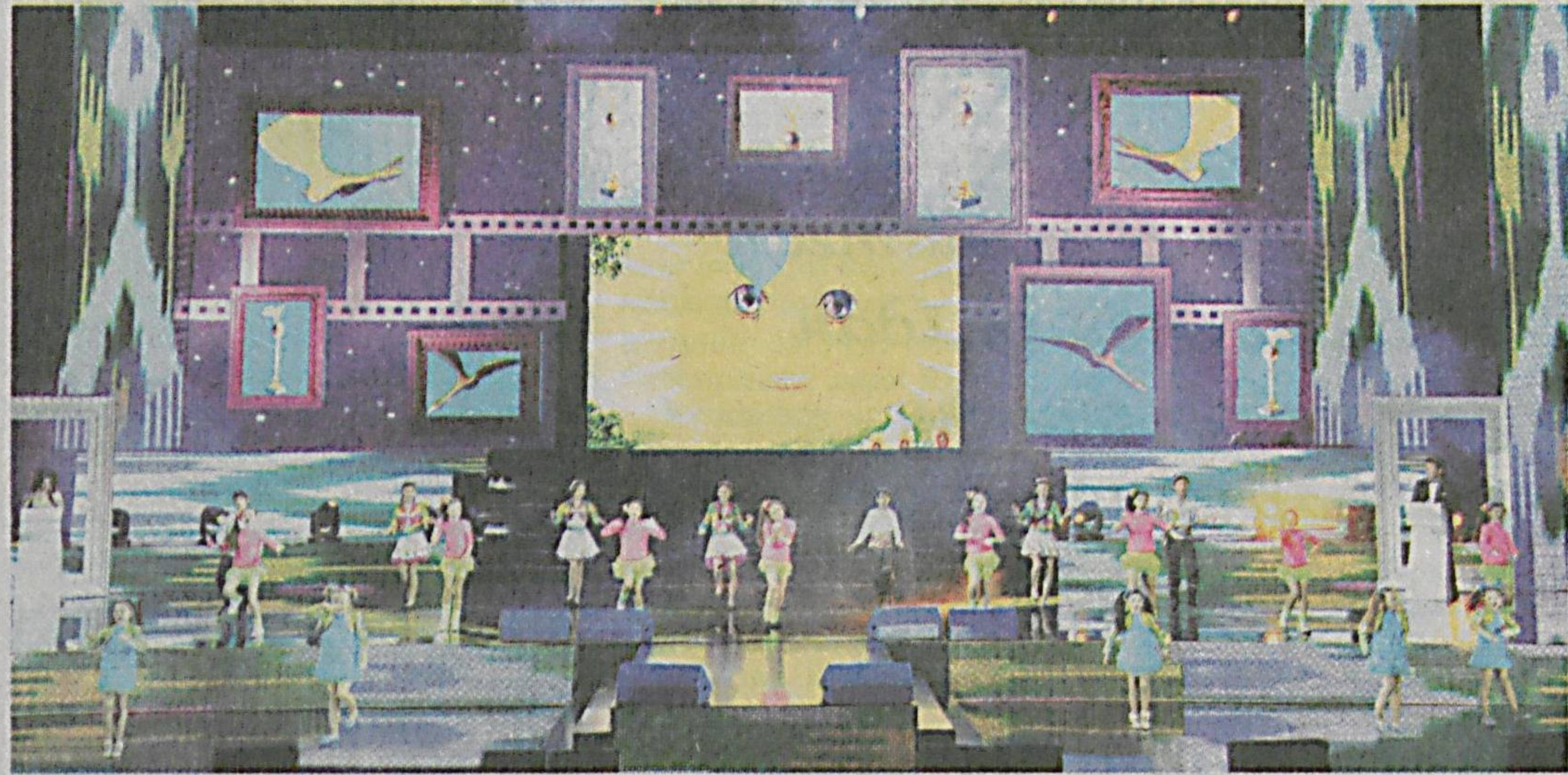
(Давоми. Бошланиши 1-саҳифада).

«Истиқлол» саройида 20 декабр кuni Ўзбекистон Республикаси Маданият ва спорт ишлари вазирлиги ҳамда қатор ҳамкор ташкилот ва идоралар билан биргаликда маданият, санъат, бадий ижод, журналистика ва спорт соҳаларида салмоқли ютуқларга эришган энг фаол ижодкорларни қўллаб-қувватлаш ва рағбатлантириш, уларнинг фаолиятини кенг омма-лаштириш мақсадида ташкил этилган «Эштироф» мукофоти совриндорларини тақдирлаш маросими бўлиб ўтди. Ўзбекистон Республикаси маданият ва спорт ишлари вазири М.Ҳожиматов ва бошқалар Президентимиз Ислам Каримов раҳнамолигида истиқлол йилларида миллий маънавиятимизни тиклаш, уни замон талаблари асосида ривожлантириш, ёшларнинг миллий санъатимиз ва маданиятимиз воситасида юксак филизлатлар соҳиб этиб камолга етказиш борасида улкан ишлар амалга оширилаётганини таъкидлади.