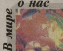
В мире о нас

В частности, заместитель председателя Избирательной комиссии Малайзии Ван Ахмад Ван Умар, принимавший участие в парламентских выборах в Узбекистане в качестве международного наблюдателя, акцентировал внимание на положениях доклада, касающихся социально-экономического развития Узбекистана. В частности, он высоко оценил проводимую политику страны экономической политики и успешную реализацию Антикризисной программы мер на 2009—2012 гг., которые способствовали обеспечению прироста ВВП страны на 8,1 процента в 2009 году