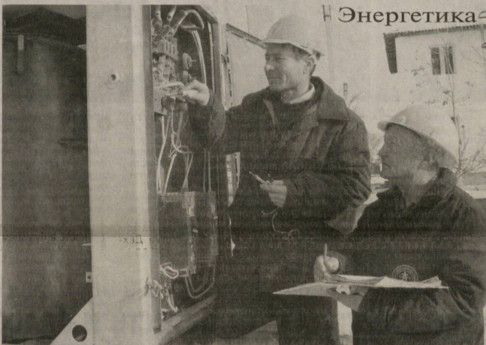
Бесперебойная работа всех участков дочернего предприятия электросетей Мирзачульского района Джизакской области является результатом своевременной и качественно проведенной подготовительной работы.

В соответствии с заранее разработанным планом мероприятий была произведена замена изношенного оборудования на участках, где оно уже отработало положенный срок. Благодаря этому удалось существенно сократить потери, связанные с непродуктивной